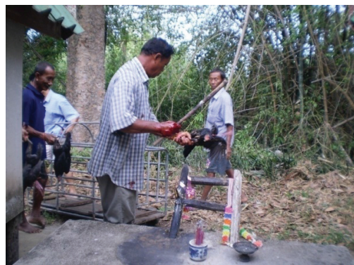
ภาพที่ 2 ไก่เป็นและหมูเป็น ฆ่าบริเวณบันไดหลักเมือง ที่มา: พิธีเลี้ยงผี บ้านทุ่งผักกูด