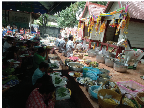
ภาพที่ 1 พิธีเลี้ยงผีที่หอผีบ้านกงลาดและบ้านทุ่งผักกูด