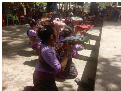
ภาพที่ 4 นางพ้อนในพิธีพ้อนถวายผี