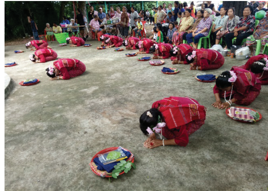
ภาพที่ 3 พาสมาในพิธีพ้อนถวายผี