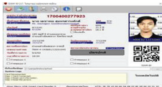
ภาพที่ 1 หน้าจอโปรแกรม SIAM ID

1) หน้าจออ่านสมาร์ทการ์ด ผ่านโปรแกรม SAIM-ID เพื่อบันทึกข้อมูลการเข้า-ออกของนักเรียน โดยใช้พร้อมกันหน้าระบบบันทึกการเข้า-ออกโรงเรียนด้วยสมาร์ทการ์ด กรณีศึกษา โรงเรียนสายธรรมจันทร์ โปรแกรม SAIM-ID ใช้สำหรับอ่านข้อมูลบนบัตรสมาร์ทการ์ดเก็บบันทึกข้อมูลเป็น Textfile แล้วนำข้อมูล Textfile ที่ได้บันทึกไว้ไปแสดงในระบบบันทึกการเข้า-ออก ดังภาพที่ 1