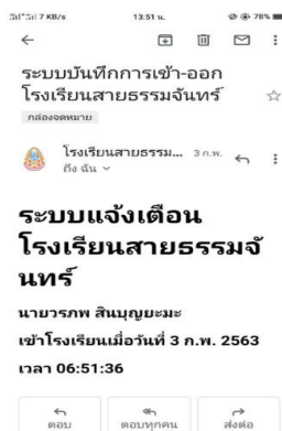
ภาพที่ 4 หน้าจอรายงานการเข้า-ออกของนักเรียนผ่านอีเมลบนหน้าจอโทรศัพท์

4) หน้าจอรายงานการเข้า-ออกของนักเรียน เป็นการส่งรายงานผ่านอีเมลถึงผู้ปกครองของนักเรียน ประกอบด้วยตราสัญลักษณ์ของโรงเรียน ชื่อโรงเรียน ข้อความระบบแจ้งเตือนของโรงเรียน แสดงชื่อและนามสกุลของนักเรียน วัน/เดือน/ปี เวลาเข้าโรงเรียน หรือเวลาออกจากโรงเรียน ดังภาพที่ 4