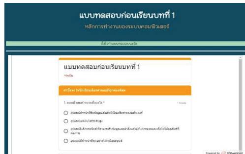
(ค) แบบทดสอบ