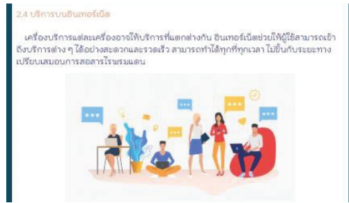
(ข) เนื้อหา