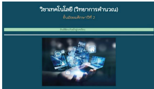
(ก) หน้าแรก

บทเรียนอีเลิร์นนิ่ง เรื่อง เทคโนโลยี (วิทยาการคำนวณ) สำหรับนักเรียนชั้นมัธยมศึกษาปีที่ 2 โรงเรียนศรีวิชัยวิทยา ประกอบด้วยเนื้อหาจำนวน 3 ตอน ได้แก่ 1) หลักการทำงานของระบบคอมพิวเตอร์ 2) เทคโนโลยีการสื่อสาร และ 3) การใช้งานเทคโนโลยีสารสนเทศอย่างมีความรับผิดชอบ ตัวอย่างหน้าจอบทเรียนอีเลิร์นนิ่ง แสดงดังภาพที่ 1