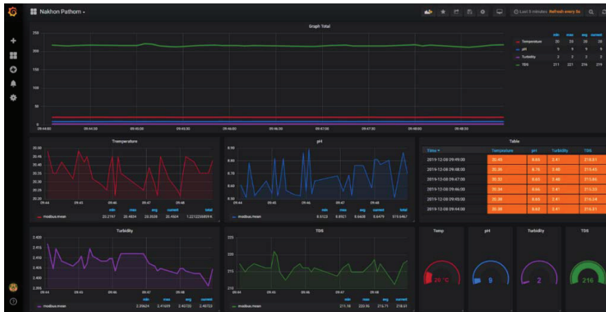
รูปที่ 4 หน้าจอการนำเสนอข้อมูลผ่าน Grafana เครื่องแม่ข่าย

ที่เครื่องแม่ข่ายจะทำการสร้างหน้าจอแสดงผลจากซอฟต์แวร์ Grafana [5] เนื่องจากซอฟต์แวร์ดังกล่าวมีความสามารถสูงในการแสดงผลของทั้งข้อมูลในปัจจุบัน (Live data) ข้อมูลย้อนหลัง และยังสามารถวิเคราะห์ข้อมูลทางสถิติ นอกจากนี้ยังทำการติดตั้งข้อมูลฐานข้อมูลแบบเวลาจริง InfluxDB [6] ที่เครื่องแม่ข่ายเพื่อความสะดวกในการเชื่อมต่อกับโปรแกรม Grafana โดยเครื่องแม่ข่ายจะใช้โปรแกรม Node-red เปิดรับข้อมูลผ่านทาง MQTT โพรโทคอล ถอดข้อมูลจากรูปแบบ JSON จัดเก็บลงในฐานข้อมูล InfluxDB ส่วนทำงานคู่ขนาน Grafana เชื่อมต่อกับ InfluxDB นำข้อมูลมาแสดงผล ดังรูปที่ 4