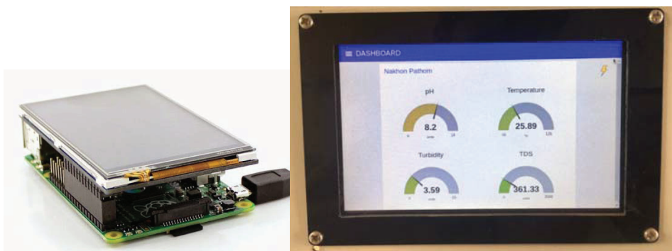
รูปที่ 3 การทำงานของ Raspberry pi ในส่วนของการแสดงผลแบบเวลาจริง ด้วย Node-red

นอกจากนี้ในส่วนของ Raspberry pi ยังออกแบบให้ทำหน้าที่จัดเก็บข้อมูลลงฐานข้อมูลแบบเวลาจริงด้วย MongoDB [4] เพื่อรองรับการนำข้อมูลไปประยุกต์ใช้ผ่านทางโปรโตคอล REST และเพื่อให้ระบบสามารถทำงานแบบ