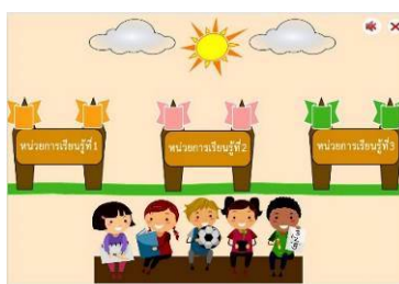
(ข) เข้าสู่บทเรียน