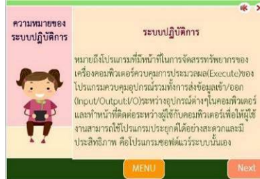
(จ) เนื้อหา