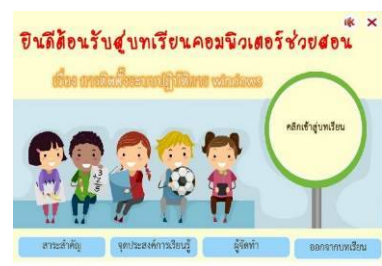
(ค) ข้อมูลเบื้องต้น