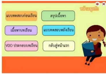
(ง) เมนูหลัก