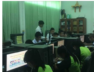
(ซ) ภาพการทดลอง 2