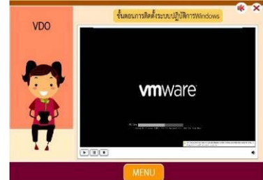
ตัวอย่าง (ฉ)วิดีโอ