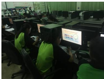
(ซ) ภาพการทดลอง 1

การทดลองใช้บทเรียนคอมพิวเตอร์ช่วยสอนกับกลุ่มตัวอย่าง แสดงดังภาพ ซ-ซ