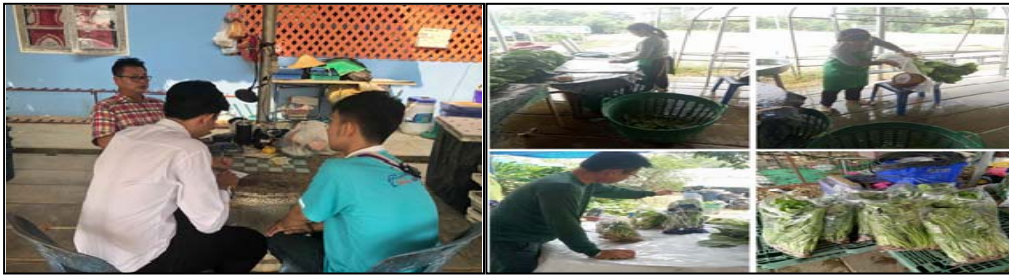
ภาพที่ 2 การสัมภาษณ์ประธานกลุ่มฯ

เข้ามา ศึกษาดูงานของนักวิชาการ, นักศึกษา, หรือชาวต่างชาติที่ให้ความสนใจเกี่ยวกับ, การบริหารจัดการ, กระบวนการผลิต และผลิตภัณฑ์ของกลุ่ม หรือการประสานงาน ของหน่วยงานต่าง ๆ ที่เกี่ยวข้อง