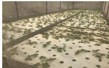
ภาพที่ 1 การปลูกผักไฮโดรโปนิคส์ของบ้านทุ่งรางเทียน