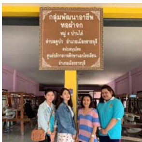
ภาพที่ 5 การลงพื้นที่