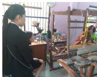
ภาพที่ 9 กระบวนการทอผ้า