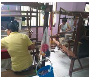
ภาพที่ 8 กระบวนการทอผ้า