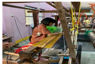
ภาพที่ 10 กระบวนการทอผ้า