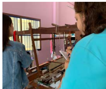
ภาพที่ 6 การลงพื้นที่