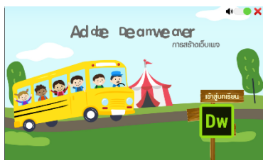
ภาพที่ 1 หน้าเข้าสู่บทเรียน

เมื่อพัฒนาบทเรียนคอมพิวเตอร์ช่วยสอนเสร็จเรียบร้อย ผู้วิจัยได้นำบทเรียนคอมพิวเตอร์ช่วยสอนไปให้ผู้เชี่ยวชาญด้านเนื้อหา และด้านเทคนิคและวิธีการ ประเมินคุณภาพบทเรียนคอมพิวเตอร์ช่วยสอน ได้ผลการประเมินดังตารางที่ 1