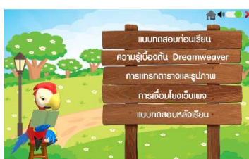
ภาพที่ 2 หน้าเมนู