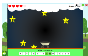
ภาพที่ 4 เกมเสริมทักษะ