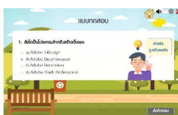
ภาพที่ 5 แบบทดสอบ