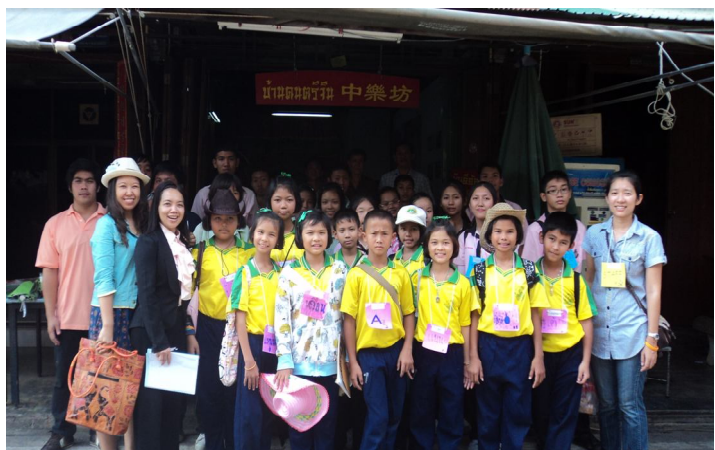
ภาพที่ 3 คู่มือการอบรมมัคคุเทศก์ท้องถิ่น และเยาวชนที่เข้ารับการอบรม