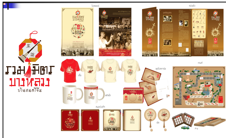
ภาพที่ 5 ตัวอย่างการนำตราสัญลักษณ์มาใช้ประโยชน์ในเชิงพาณิชย์

มหาวิทยาลัยราชภัฏนครปฐมได้รับทุนสนับสนุนจาก สำนักงานกองทุนสนับสนุนการส่งเสริมสุขภาพ (สสส.) ให้นำพา วงดนตรีจีนรวมมิตรบางหลวงไปร่วมแสดงในงานต่างๆ อาทิเช่น งาน ๗ ทศวรรษลูกทุ่งไทย น้อมใจถวายพระพร งานประชุม วิชาการระดับชาติและนานาชาติของเครือข่ายสหวิทยาการแห่งราชบัณฑิตยสถาน งานวัฒนธรรมนานาชาติ ศูนย์วัฒนธรรม แห่งชาติสิริกิติ์ งาน Thailand Research Expo 2012 ของสภาวิจัยแห่งชาติ เป็นต้น นอกจากนี้สถานีโทรทัศน์ TCC.TV จากประเทศจีน ได้มาถ่ายทำสารคดีเรื่องราวของดนตรีจีนโบราณที่ยังหลงเหลืออยู่ในประเทศไทย คือ ดนตรีจีนของชุมชนบางหลวง ร่วมกับรายการสารพัน ใต้แผ่นดินฟ้า เพื่อนำไปเผยแพร่ออกอากาศที่ประเทศจีน