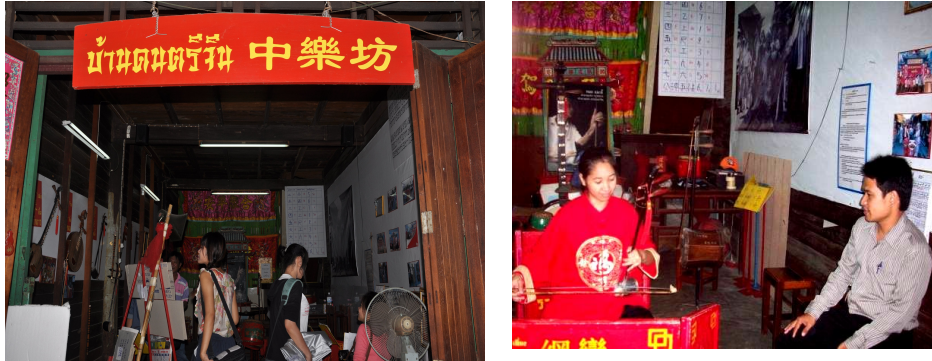
ภาพที่ 4 การเผยแพร่ความรู้ ณ บ้านดนตรีจีน

5. ปัจจุบันดนตรีจีนของชุมชนบางหลวงได้ถูกพิจารณาในด้านการอนุรักษ์และสืบสานวัฒนธรรมเพื่อคงเอกลักษณ์ของพื้นที่ไว้ จึงมีความเหมาะสมในการนำไปใช้ในรูปแบบของการท่องเที่ยวเชิงวัฒนธรรม 3 ลักษณะ ได้แก่ 1) การเล่นดนตรีตามกิจกรรมประเพณีที่มีมาแต่ดั้งเดิม 2) การแสดงในงานหรือกิจกรรมทั้งภายในและภายนอกชุมชน และ 3) การเผยแพร่ความรู้ในการเล่นดนตรีจีนแก่นักท่องเที่ยวและผู้สนใจทั่วไป ณ บ้านดนตรีจีนของชุมชน