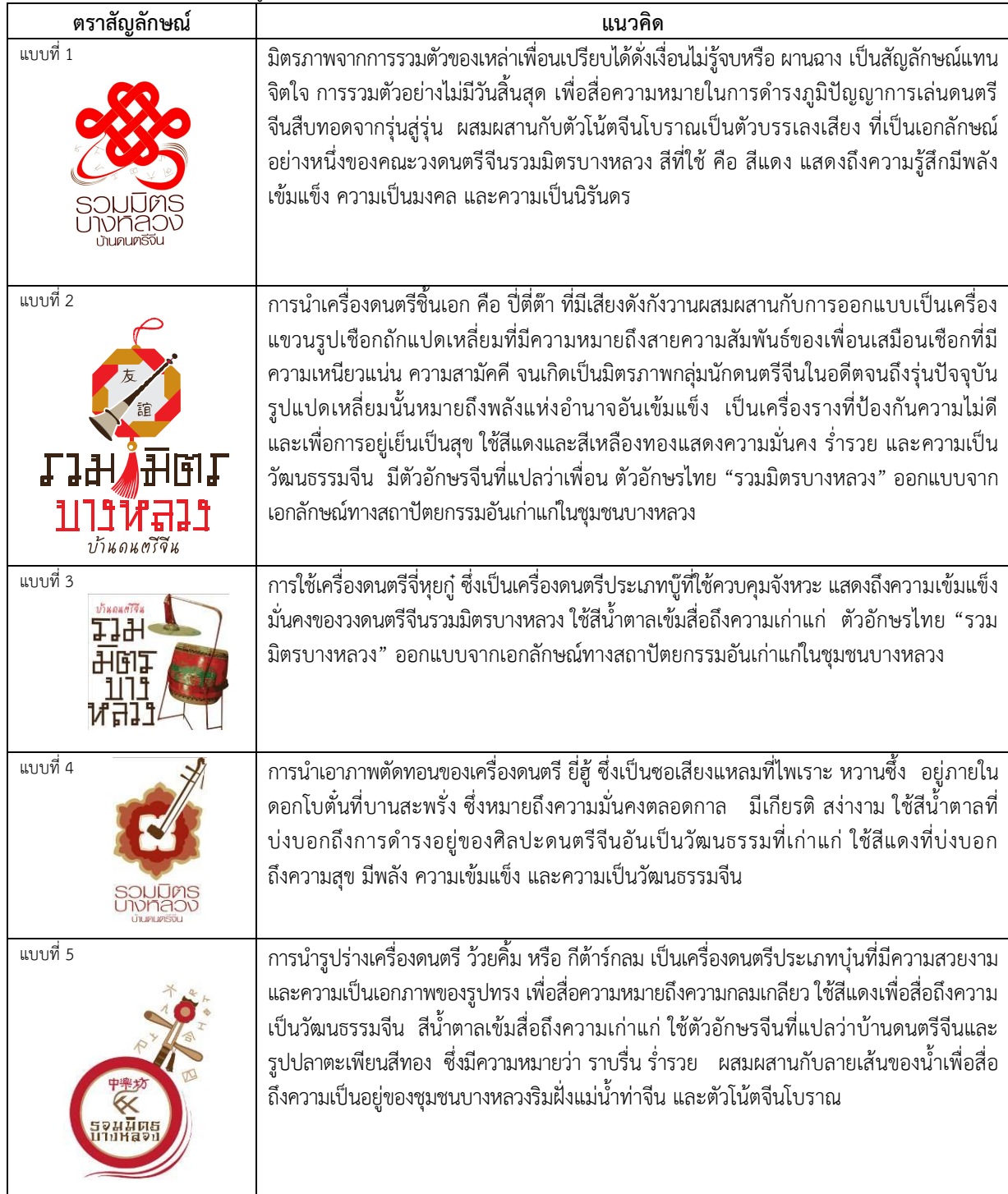
ตารางที่ 1 ลักษณะเรขศิลป์ในรูปแบบตราสัญลักษณ์วงดนตรีจีนรวมมิตรบางหลวงที่มีแนวคิด 5 แบบ

หมายเหตุ : แบบที่ 2 เป็นแบบที่ได้รับความนิยมสูงสุด