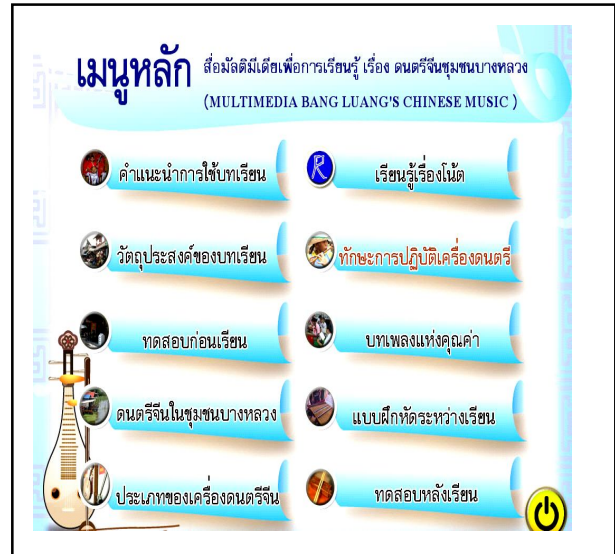
ภาพที่ 2 ตัวอย่างหน้าปก และหน้าเมนูหลักของสื่อมัลติมีเดีย

3. เกิดมัคคุเทศก์ท้องถิ่นจำนวน 20 คน (เยาวชน) และหลักสูตรการอบรมมัคคุเทศก์ท้องถิ่นประกอบด้วยหน่วยการเรียนรู้ 6 หน่วย ใช้เวลาการฝึกอบรม 5 วันๆ ละ 6 ชั่วโมง รวมทั้งสิ้น 30 ชั่วโมง แบ่งเป็น 2 ส่วน ได้แก่ 1) เนื้อหาการฝึกอบรมภาคทฤษฎี ประกอบด้วยหน่วยที่ 1 มัคคุเทศก์ท้องถิ่น หน่วยที่ 2 การสื่อสารเชิงวัฒนธรรมกับการท่องเที่ยวเชิงวัฒนธรรม และหน่วยที่ 3 ภูมิปัญญาดนตรีจีนชุมชนบางหลวง 2) เนื้อหาการฝึกอบรมภาคปฏิบัติ ประกอบด้วยหน่วยที่ 4 มัคคุเทศก์ท้องถิ่นภาคสนาม 1 ฝึกปฏิบัติสาธิตการนำชมแหล่งท่องเที่ยวภูมิปัญญาดนตรีจีน หน่วยที่ 5 การพัฒนาบุคลิกภาพและเทคนิคในการสื่อสาร และหน่วยที่ 6 มัคคุเทศก์ท้องถิ่นภาคสนาม 2 ฝึกปฏิบัติการมัคคุเทศก์ท้องถิ่น เพื่อนำชมวัฒนธรรมภูมิปัญญาดนตรีจีนบางหลวง ผลการประเมินองค์ประกอบของหลักสูตรฝึกอบรมจากผู้เชี่ยวชาญในภาพรวมอยู่ในระดับมาก ( \bar{X} = 4.45, S.D. = 0.51) ผลการทดลองนำหลักสูตร ไปใช้ พบว่า ความพึงพอใจของผู้เข้ารับการฝึกอบรมต่อหลักสูตรการฝึกอบรมมัคคุเทศก์ท้องถิ่นโดยภาพรวมอยู่ในระดับมากที่สุด ( \bar{X} = 4.68, S.D. = 0.33)