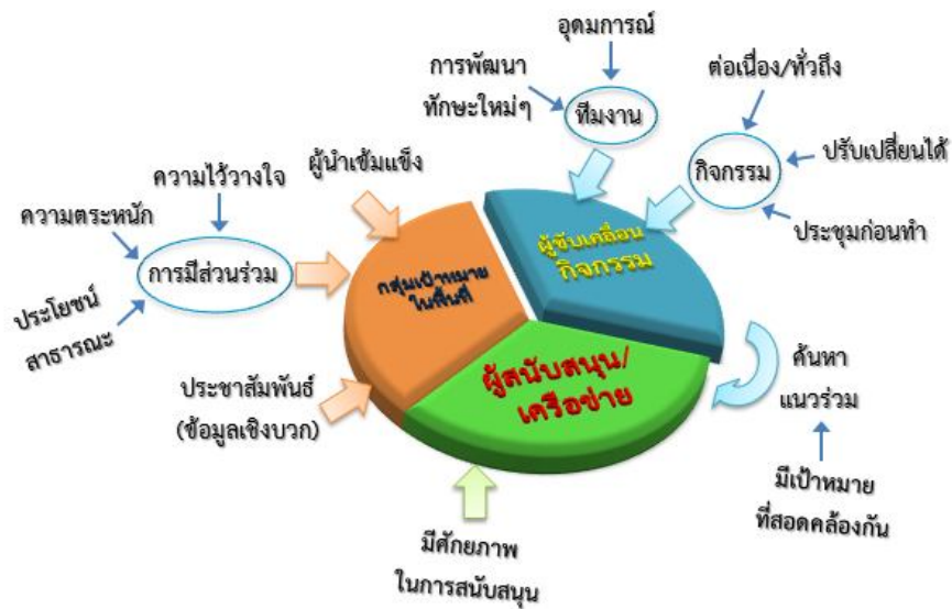
รูปที่ 2 ตัวแบบที่เหมาะสมตามแนวทางการบูรณาการความร่วมมือในการป้องกันปัญหาอาชญากรรม

แนวทางการบูรณาการความร่วมมือในการป้องกันปัญหาอาชญากรรมมีองค์ประกอบที่สำคัญดังนี้