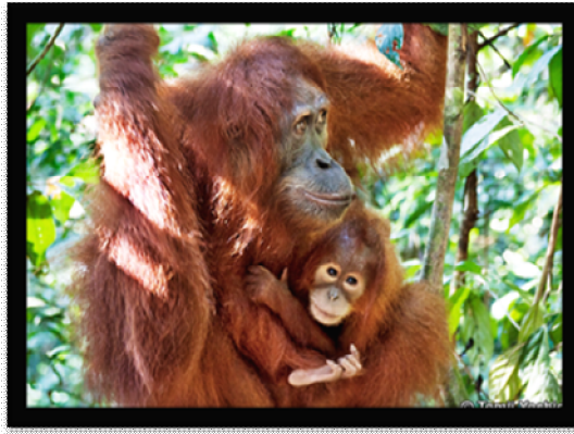
ภาพที่ 11 อูรังอุตัง: สัตว์ท้องถิ่นของสุมาตรา