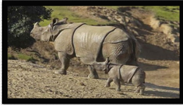
ภาพที่ 5 แรดชวา สัตว์ป่าหายากที่บนได้ในอุทยานแห่งชาติอุจุงกูลอน

อุทยานแห่งชาติอุจุงกูลอน (Ujung Kulon National Park) เป็นมรดกโลกทางธรรมชาติแห่งแรกของอินโดนีเซีย มีเนื้อที่รวมประมาณ 782 ตารางกิโลเมตร ครอบคลุมพื้นที่คาบสมุทรอุจุงกูลอน และหมู่เกาะนอกฝั่ง รวมถึงเขตอนุรักษ์ธรรมชาติ กรากะตัว ซึ่งเป็นที่ตั้งของภูเขาไฟกรากะตัว ซึ่งเคยเกิดระเบิดครั้งใหญ่ในปี พ.ศ. 2426 สร้างความเสียหายรุนแรงที่สุดครั้งหนึ่งของโลก (แรงสั่นสะเทือนและหมอกละอองภูเขาไฟ รู้สึกได้ถึงกรุงเทพฯ ทำให้เกิดคลื่นสึนามิ และมีฝนละอองจากเถ้าครอบคลุมพื้นที่หนาถึง 30 ซม.) แสดงให้เห็นถึงการวิวัฒนาการของกระบวนการทางธรณีวิทยา เป็นแหล่งที่น่าสนใจในการศึกษาภูเขาไฟ