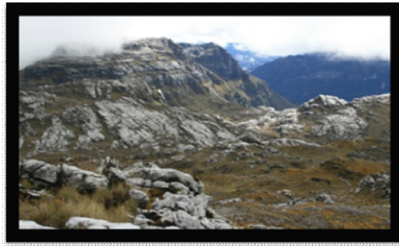
ภาพที่ 8 ยอดเขาปุนจะกัจจา (Puncak Jaya) อุทยานแห่งชาติลอเรนซ์ สุดยอดที่เกี่ยวผจญภัยแห่งอินโดนีเซีย

4. มรดกป่าฝนเขตร้อนของเกาะสุมาตรา (Tropical Rainforest Heritage of Sumatra) มรดกป่าฝนเขตร้อนของเกาะสุมาตรา (Tropical Rainforest Heritage of Sumatra) ประกอบด้วยอุทยานแห่งชาติ 3 แห่ง คือ อุทยานแห่งชาติกุนุงลูเซอร์ (Gunung Leuser) อุทยานแห่งชาติเครินซีเซบลัต (Kerinci Seblat) และอุทยานแห่งชาติบูกิตบาริสานเซลาดัน (Bukit Barisan Selatan) มีเนื้อที่รวม 2.5 ล้านเฮกเตอร์ (ประมาณ 25,000 ตารางกิโลเมตร) ป่าฝนเขตร้อนของเกาะสุมาตราเป็นบริเวณนี้มีศักยภาพสูงที่สุดสำหรับการอนุรักษ์ความหลากหลายทางชีวภาพและเป็นที่อยู่ของสิ่งมีชีวิตที่กำลังสูญพันธุ์ เป็นที่อาศัยของพืชประมาณ 10,000 สายพันธุ์ รวมทั้งพืชเฉพาะถิ่น 17 ตระกูล สัตว์เลี้ยงลูกด้วยนมมากกว่า 200 สายพันธุ์ นก 580 สายพันธุ์ ซึ่ง 465 สายพันธุ์เป็นนกที่อยู่ประจำ และอีก 21 สายพันธุ์เป็นนกที่มาเป็นครั้งคราว สัตว์เลี้ยงลูกด้วยนม 22 สายพันธุ์ เป็นสายพันธุ์เอเชียซึ่งไม่เคยพบในที่อื่นในหมู่เกาะของอินโดนีเซีย และอีก 15 สายพันธุ์มีอยู่เฉพาะอินโดนีเซีย รวมไปถึงสัตว์ท้องถิ่นของสุมาตรา คือ อูรังอุตัง 7