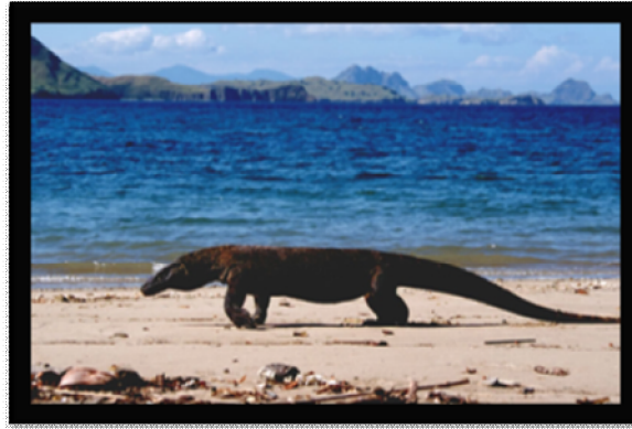
ภาพที่ 2 อุทยานแห่งชาติโกโมโด (Komodo National Park)