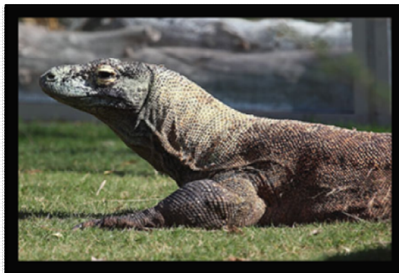
ภาพที่ 1 อุทยานแห่งชาติโกโมโด (Komodo National Park)

อุทยานแห่งชาติโกโมโดได้รับการขึ้นทะเบียนเป็นมรดกโลก โดยมีคุณสมบัติตรงตามข้อกำหนดและหลักเกณฑ์ในการ พิจารณามรดกโลกด้านธรรมชาติ จำนวน 2 ข้อ คือ เป็นตัวอย่างที่เด่นชัดของการเป็นตัวแทนในวิวัฒนาการสำคัญต่างๆในอดีต ของโลก เช่น ยุคสัตว์เลื้อยคลาน ยุคน้ำแข็ง ซึ่งสะท้อนให้เห็นถึงการพัฒนาความหลากหลายทางธรรมชาติบนพื้นโลก และเป็น ถิ่นที่อยู่อาศัยของชนิดสัตว์และพันธุ์พืชที่หายากหรือที่ตกอยู่ในสภาวะอันตราย แต่ยังคงสามารถดำรงชีวิตอยู่ได้ ซึ่งรวมถึง ระบบนิเวศอันเป็นแหล่งรวมความอุดมสมบูรณ์ของพืชและสัตว์ที่ทั่วโลกให้ความสนใจ 4