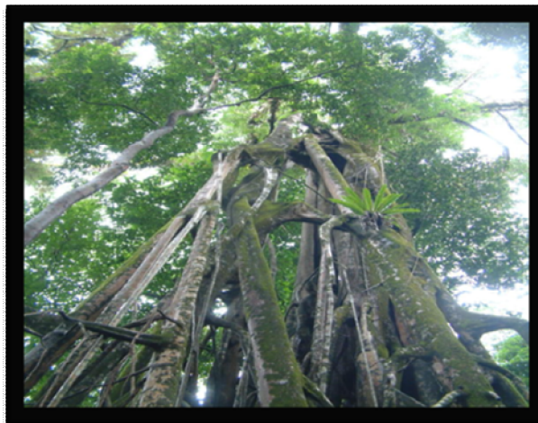
ภาพที่ 4 อุทยานแห่งชาติอุจุงกูลอน (Ujung Kulon National Park)

2. อุทยานแห่งชาติอุจุงกูลอน (Ujung Kulon National Park) อุทยานแห่งชาติอุจุงกูลอน ตั้งอยู่ที่ปลายสุดด้านตะวันตกของเกาะชวา บนไหล่ทวีปซุนดา อยู่ในพื้นที่จังหวัดบันเตน (Banten) ในเขตพื้นที่เกาะชวา และจังหวัดลัมปุง (Lampung) ในเขตพื้นที่ของเกาะสุมาตรา ของอินโดนีเซีย และรวมถึงเขตอนุรักษณ์ธรรมชาติกรากะตั่ว (Krakatoa) ด้วย นอกเหนือจากธรรมชาติสวยงามพร้อมกับลักษณะธรณีวิทยาที่น่าสนใจเพื่อการศึกษาภูเขาไฟบนแผ่นดินตอนใน อุทยานแห่งชาตินี้ยังมีป่าฝนพื้นที่ต่ำที่ราบชวา สัตว์และพืชใกล้สูญพันธุ์ รวมถึงแรดชวา 5