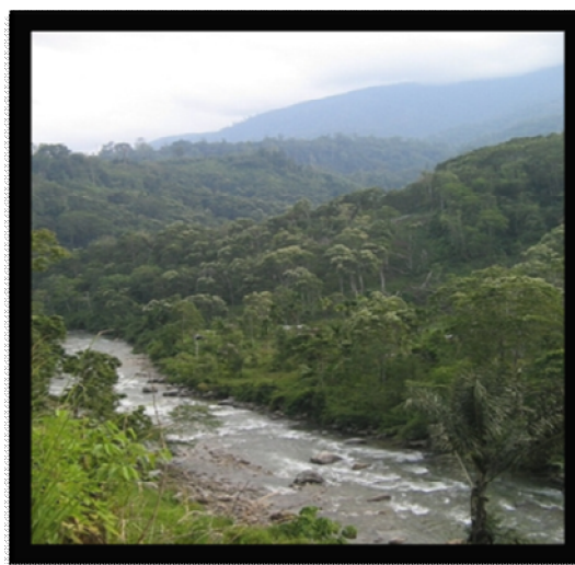
ภาพที่ 10 มรดกป่าฝนเขตร้อนของเกาะสุมาตรา (Tropical Rainforest Heritage of Sumatra)

4. มรดกป่าฝนเขตร้อนของเกาะสุมาตรา (Tropical Rainforest Heritage of Sumatra) มรดกป่าฝนเขตร้อนของเกาะสุมาตรา (Tropical Rainforest Heritage of Sumatra) ประกอบด้วยอุทยานแห่งชาติ 3 แห่ง คือ อุทยานแห่งชาติกุนุงลูเซอร์ (Gunung Leuser) อุทยานแห่งชาติเครินซีเซบลัต (Kerinci Seblat) และอุทยานแห่งชาติบูกิตบาริสานเซลาดัน (Bukit Barisan Selatan) มีเนื้อที่รวม 2.5 ล้านเฮกเตอร์ (ประมาณ 25,000 ตารางกิโลเมตร) ป่าฝนเขตร้อนของเกาะสุมาตราเป็นบริเวณนี้มีศักยภาพสูงที่สุดสำหรับการอนุรักษ์ความหลากหลายทางชีวภาพและเป็นที่อยู่ของสิ่งมีชีวิตที่กำลังสูญพันธุ์ เป็นที่อาศัยของพืชประมาณ 10,000 สายพันธุ์ รวมทั้งพืชเฉพาะถิ่น 17 ตระกูล สัตว์เลี้ยงลูกด้วยนมมากกว่า 200 สายพันธุ์ นก 580 สายพันธุ์ ซึ่ง 465 สายพันธุ์เป็นนกที่อยู่ประจำ และอีก 21 สายพันธุ์เป็นนกที่มาเป็นครั้งคราว สัตว์เลี้ยงลูกด้วยนม 22 สายพันธุ์ เป็นสายพันธุ์เอเชียซึ่งไม่เคยพบในที่อื่นในหมู่เกาะของอินโดนีเซีย และอีก 15 สายพันธุ์มีอยู่เฉพาะอินโดนีเซีย รวมไปถึงสัตว์ท้องถิ่นของสุมาตรา คือ อูรังอุตัง 7