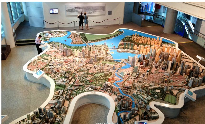
ภาพที่ 4 ภาพโมเดลเกาะสิงคโปร์และแผนการพัฒนาในอนาคตที่พิพิธภัณฑ์แห่งชาติสิงคโปร์

หลายคนอาจมองว่า สิงคโปร์มาถึงจุดที่เป็นประเทศที่พัฒนาแล้ว ครบครันด้วยสาธารณูปโภคขั้นพื้นฐานทั้งปวง เป็นประเทศมหาอำนาจทางเศรษฐกิจอันดับต้น ๆ ของโลก มากมายไปด้วยโอกาสทางการค้าและการลงทุนแก่นักลงทุนรายใหญ่ และเป็นประเทศที่มีหาอำนาจโลกจับตามองทางด้านเศรษฐกิจและการพัฒนา แต่อะไรล่ะที่เป็นสิ่งสำคัญที่ผลักดันให้สิงคโปร์เป็นอย่างทุกวันนี้ได้ อะไรที่เป็นแรงขับเคลื่อนการพัฒนาของประเทศได้อย่างเช่นทุกวันนี้ย่อมเป็นเรื่องที่นำศึกษา มากกว่า