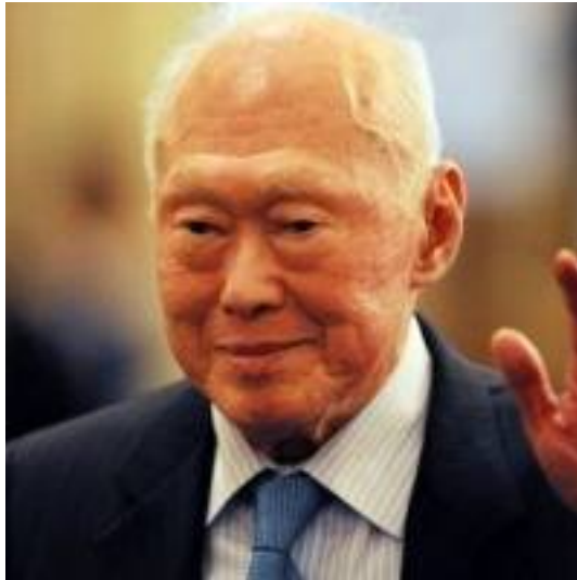
ภาพที่ 1 ภาพนายลี กวนยู