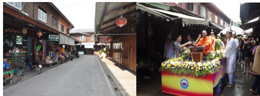
กิจกรรมการท่องเที่ยวในพื้นที่