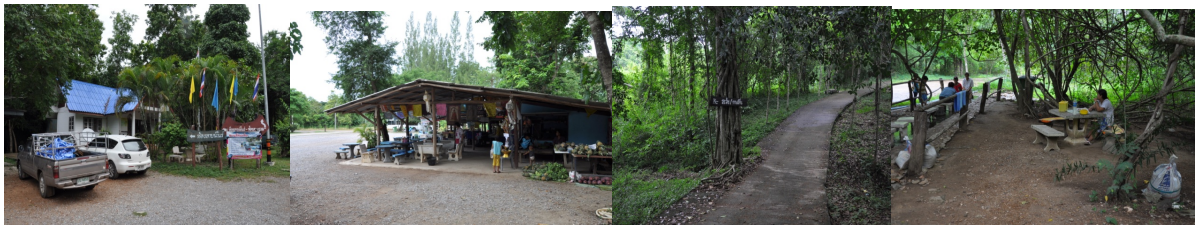
ลานจอดรถ และบ่อน้ำพุร้อน ร้านอาหารและร้านค้าชุมชน เส้นทางเดินสู่อบอุ่นน้ำพุร้อน สภาพโดยรอบบ่อน้ำพุร้อน