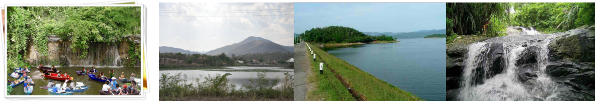
ตลาดน้ำ และน้ำตกกว้างโจ้ว ทิวทัศน์ภาพเส้นทางสู่น้ำพุร้อน เขื่อนแก่งกระจาน น้ำตกแม่กระดังงา