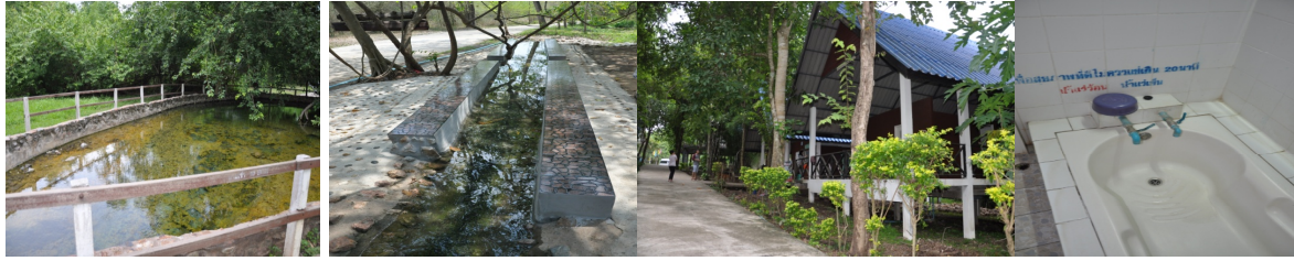
สภาพแวดล้อมบ่อน้ำร้อน (บ่อใหญ่) บริเวณพื้นที่บ่อแช่เท้า อาคารสำหรับบ่อแช่ตัว ภายในห้องแช่ตัว (เดี่ยว)

แหล่งน้ำพุร้อนหนองหญ้าปล้อง อยู่ภายใต้การดูแลของชุมชนบ้านน้ำพุร้อนหนองหญ้าปล้อง ได้รับอนุญาตจัดตั้งดูแลพื้นที่เมื่อวันที่ 30 มิถุนายน พ.ศ. 2555 โดยตั้งอยู่ ณ หมู่ที่ 5 ตำบลยางน้ำกลัดเหนือ อำเภอหนองหญ้าปล้อง จังหวัดเพชรบุรี เป็นบ่อน้ำอุ่น ที่เกิดอยู่ระหว่างเขตที่ดินสาธารณประโยชน์ และป่าสงวนแห่งชาติ บ่อน้ำร้อนมีทั้งหมด 3 บ่อ เรียงกันแนวเหนือ-ใต้ โดยน้ำจะไหลจากบ่อทางทิศเหนือ ไปทางทิศใต้ แต่ละบ่อมีเส้นผ่าศูนย์กลางประมาณ 3-5 เมตร ลึกประมาณ 30 เซนติเมตร ในอดีตพื้นที่บริเวณนี้เป็นผืนป่า และมีชุมชนอยู่อาศัยมาแล้วประมาณ 90 กว่าปี โดยในภายหลังชาวบ้านได้พบแหล่งน้ำพุร้อนจำนวน 3 บ่อ จึงได้เริ่มมีการพัฒนาพื้นที่เพื่อรองรับนักท่องเที่ยวอย่างเป็นทางการในปี พ.ศ. 2544 งบประมาณหลักที่ได้รับสำหรับการพัฒนาส่วนใหญ่มาจากองค์การบริหารส่วนจังหวัดเพชรบุรี