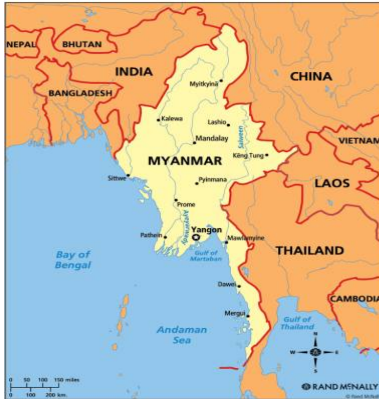
ภาพที่ 00 แผนที่แสดงอาณาเขตเมียนมาร์