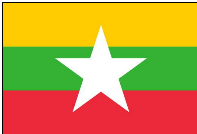
ภาพที่ 00 ธงชาติเมียนมาร์ (Myanmar Flag)

ต่อมาในเดือนกันยายน พ.ศ.2550 มีการเสนอแบบธงชาติพม่าใหม่อีกครั้ง ซึ่งได้กำหนดรวมอยู่ในร่างรัฐธรรมนูญฉบับใหม่ของสหภาพพม่าด้วย เมื่อมีการรับรองร่างรัฐธรรมนูญดังกล่าวโดยการลงประชามติในเดือนพฤษภาคม 2551 จึงเท่ากับว่าเป็นการยอมรับธงชาติพม่าใหม่ตามประชามตินี้ด้วย ลักษณะเป็นธง 3 สีรูปสี่เหลี่ยมผืนผ้า ภายในแบ่งตามแนวนอน ความกว้างเท่ากัน พื้นสีเหลือง สีเขียว และสีแดง เรียงตามลำดับจากบนลงล่าง กลางธงมีรูปดาวห้าแฉกสีขาวขนาดใหญ่ ความหมายของสัญลักษณ์ในธงชาติประกอบด้วย สีเหลืองหมายถึงความสามัคคี สีเขียวหมายถึงสันติภาพ ความสงบ และความอุดมสมบูรณ์ของพม่า สีแดงหมายถึงความกล้าหาญ ความเข้มแข็ง เด็ดขาด ดาวสีขาวหมายถึงสหภาพอันมั่นคงเป็นเอกภาพ ธงชาติใหม่ของเมียนมาร์ได้ชักขึ้นสู่เสาครั้งแรกเมื่อ 21 ตุลาคม 2553 เวลา 15.00 น. ที่กรุงเนปิดอร์ และเวลา 15.33 น. ที่นครย่างกุ้ง (เวลาท้องถิ่น) 46