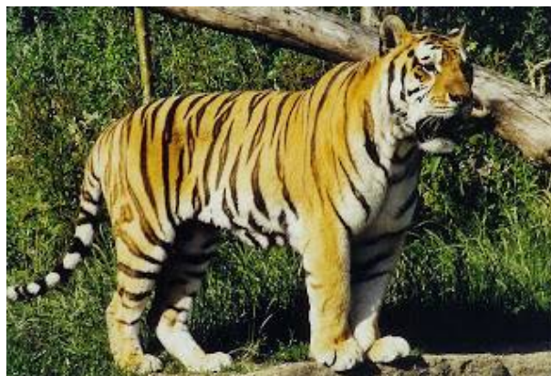
ภาพที่ 00 สัตว์ประจำชาติเมียนมาร์

5.4 สัตว์ประจำชาติ เสือ (Tiger) มีความดุร้าย ว่องไว ปราดเปรียว สามารถวิ่งได้เร็ว สง่างาม ว่ายน้ำเก่ง ปีนต้นไม้ได้คล่องแคล่ว พบได้ทั่วไปในทวีปเอเชีย และพบมากในป่าของประเทศเมียนมาร์ เสือคือดัชนีวัดความอุดมสมบูรณ์ของป่า แสดงให้เห็นถึงความอุดมสมบูรณ์ของประเทศเมียนมาร์ได้เป็นอย่างดี ดังนั้นเสือจึงถูกเลือกให้เป็นสัตว์ประจำชาติเมียนมาร์