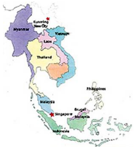
รูปภาพที่ 2 แผนที่แสดงที่ตั้งของนครคุนหมิง

เชื่อมโยงดินแดนจีนตอนใน (ไม่ติดกับประเทศอื่นๆ) กับประเทศในทวีปเอเชียตะวันออกเฉียงใต้และเอเชียใต้ เพื่อขยายความร่วมมือทางเศรษฐกิจ การค้า และการแสวงหาทางออกสู่ทะเล เป็นต้น