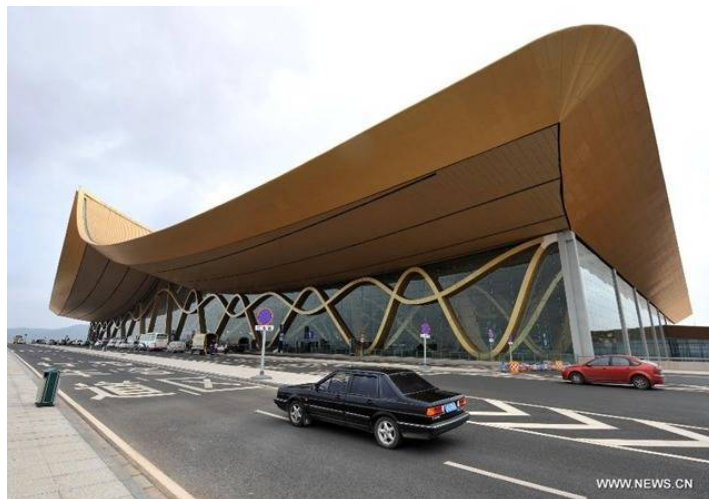
รูปภาพที่ 6 สนามบินนานาชาติฉงชู่

สนามบินฉงชู่ที่ถือว่าเป็นสนามบินอันดับ 4 ของประเทศ รองจากสนามบินปักกิ่ง เซี่ยงไฮ้ และกวางโจว ที่สร้างขึ้นใหม่เพื่อรองรับการท่องเที่ยวจากประชาชนอาเซียนไปยังนครคุนหมิง และจากคุนหมิงบินตรงถึงเมืองสำคัญๆในอาเซียนทุกวัน รวมถึงเส้นทางธรรมชาติอย่างเช่นทางแม่น้ำ ซึ่งจีนเป็นต้นกำเนิดแม่น้ำที่ไหลผ่านประเทศในอาเซียนหลายสาย อาทิ แม่น้ำของที่ถือได้ว่าเป็นแม่น้ำนานาชาติที่ไหลผ่านตั้งแต่จีน-เมียนมาร์-ลาว-ไทย-กัมพูชา และเวียดนาม และ แม่น้ำอิระวดี ที่มีต้นกำเนิดมาจากมณฑลยูนนานไหลมาผ่านมาที่ประเทศเมียนมาร์