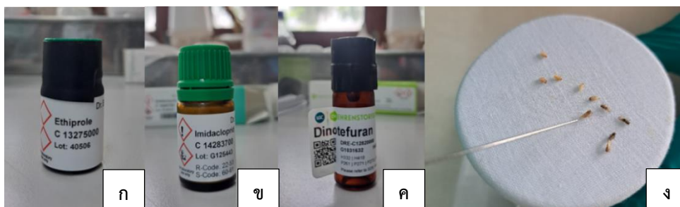
ภาพที่ 2 การประเมินความต้านทานของประชากรเพลี้ยกระโดดสีน้ำตาลภาคตะวันออกเฉียงเหนือ ต่อสารป้องกันกำจัดแมลง ethiprole (ก) imidacloprid (ข) dinotefuran (ค) โดยหยดสารบนตัวเพลี้ยกระโดดสีน้ำตาล ด้วยวิธี topical bioassay (ง)

4.1.1 นำตัวเต็มวัยเพลี้ยกระโดดสีน้ำตาล อายุ 2-3 วัน ที่เลี้ยงขยายปริมาณไว้ มาทำให้สลบด้วยก๊าซคาร์บอนไดออกไซด์ จำนวน 10 ตัวต่อซ้ำ จากนั้นหยดสารละลายที่เตรียมไว้ในข้อ 3.1 โดยใช้เครื่องหยดสาร Hamilton Dispenser หยดสารละลายปริมาณ 0.24 ไมโครลิตรต่อตัว โดยทดสอบจำนวน 3 ความเข้มข้นต่อสาร ประกอบด้วย 1) ความเข้มข้นสูง 10,000 ppm 2) ความเข้มข้นกลาง 2,500 ppm และ 3) ความเข้มข้นต่ำ 312.5 ppm แต่ละความเข้มข้นทำ 6 ซ้ำ (ภาพที่ 2)