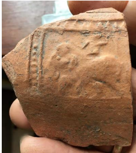
ภาพที่ 8 ภาพบนเศษภาชนะดินเผา พบที่เมืองจันเสน จังหวัดนครสวรรค์ แสดงรูปนักรบถืออาวุธบนหลังช้าง ที่มา: [17]