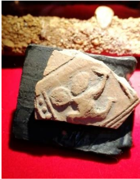
ภาพที่ 6 ภาพนักรบถืออาวุธและโล่บนเศษภาชนะดินเผา พบที่เมืองจันเสน จังหวัดนครสวรรค์ ที่มา: [15]