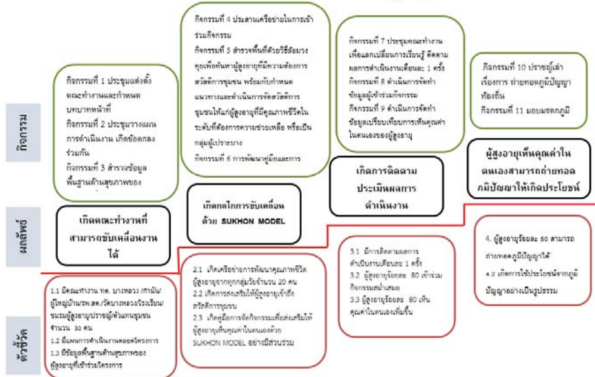
ภาพที่ 2 บันไดผลลัพธ์ในการพัฒนาการเห็นคุณค่าในตนเองของผู้สูงอายุด้วย SUKHON MODEL