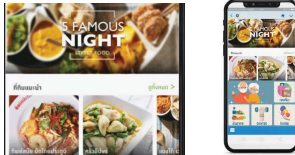
ภาพที่ 2 ออฟฟิเชียลลงป่าพาเที่ยว ที่ออกแบบจากแนวคิดจาก ผู้สูงอายุและอาจารย์นักออกแบบ