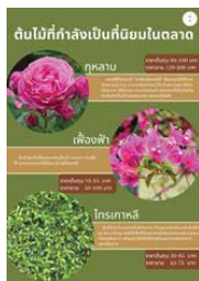
ภาพที่ 7 ต้นไม้ที่กำลังเป็นที่นิยมในตลาด