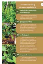
ภาพที่ 8 การเตรียมตัวเป็นผู้ประกอบการธุรกิจต้นไม้