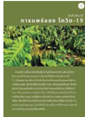
ภาพที่ 1 การแพร่ของ โควิด-19

หนังสืออิเล็กทรอนิกส์ (E-Book) เรื่อง ธุรกิจต้นไม้ในยุค Next normal สำหรับประชาชนทั่วไปที่สนใจในเรื่องการประกอบการธุรกิจต้นไม้ โดยเนื้อหาประกอบไปด้วย