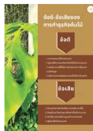
ภาพที่ 10 ข้อดี-ข้อเสียของการทำธุรกิจต้นไม้