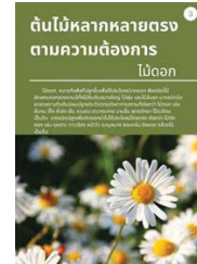
ภาพที่ 3 ไม้ดอก