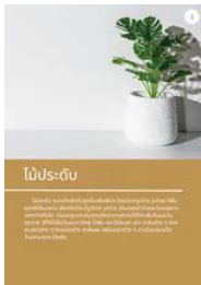
ภาพที่ 4 ไม้ประดับ