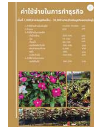
ภาพที่ 6 ค่าใช้จ่ายในการทำธุรกิจ