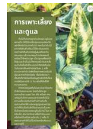
ภาพที่ 9 การเพาะเลี้ยงและดูแล