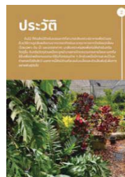
ภาพที่ 5 ไม้ใหญ่หรือไม้ยืนต้น