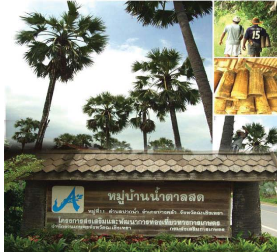
ภาพที่ 4 หมู่บ้านน้ำตาลสดตำบลปากน้ำ อำเภอบางคล้า จังหวัดฉะเชิงเทรา