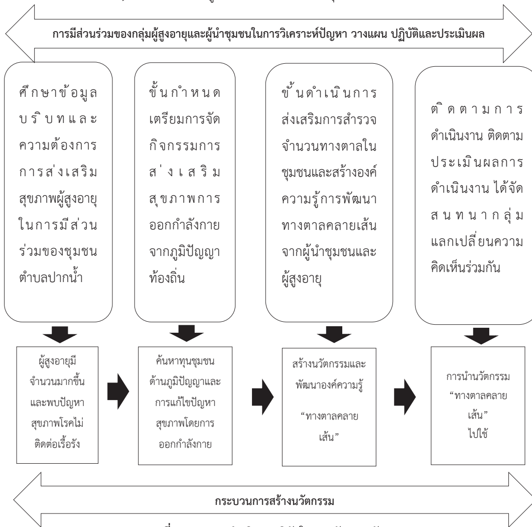
ภาพที่ 1 แผนการดำเนินงานวิจัยในการพัฒนานวัตกรรม

4.4 การเก็บรวบรวมข้อมูลสำหรับการศึกษาค้นคว้าครั้งนี้ การเก็บรวบรวมข้อมูลพื้นฐานและมีการสนทนากลุ่มเพื่อระดมความคิด เก็บข้อมูลทุกขั้นตอนที่ดำเนินการใช้วิธีการสัมภาษณ์ กระบวนการกลุ่มสัมพันธ์ สังเกต และการทำเวทีเสวนา โดยการวิเคราะห์เนื้อหา (Content Analysis) จัดระบบข้อมูลและสังเคราะห์ตามวัตถุประสงค์การวิจัย