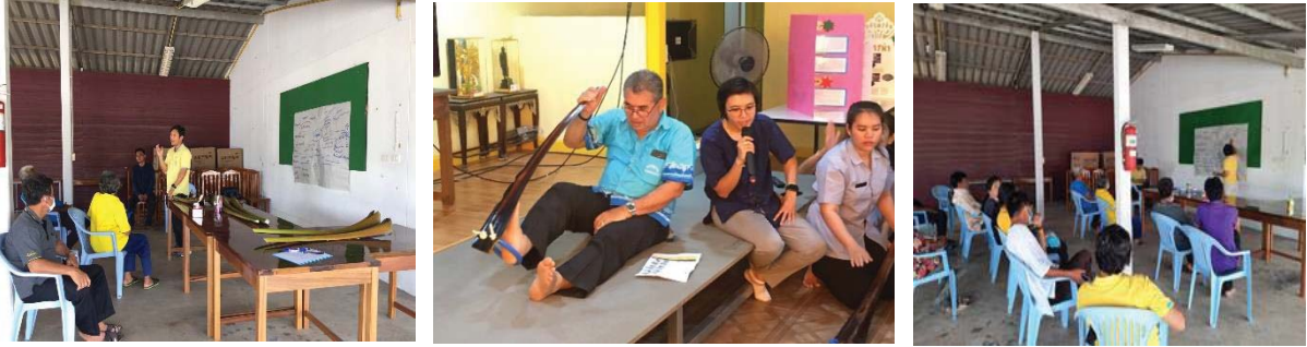
ภาพที่ 2 การมีส่วนร่วมของชุมชนในการพัฒนานวัตกรรมทางตาลคล้ายเส้น