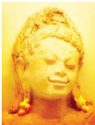
ภาพที่ 8 ประติมากรรมรูปพระโพธิสัตว์ สวมตุ้มหูสมัยทวารวดีแบบรูปทรงกรวย พบที่คูบัว