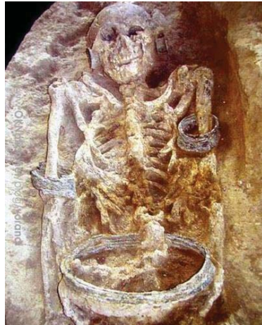
ภาพที่ 2 โครงกระดูกผู้ชายใส่ห้วงคอสำริดและเครื่องประดับอายุราว 1,800 ปี จากเนินอุโลก

ด้วยเหตุนี้จึงสามารถพบหลักฐานจำพวกเครื่องประดับได้ตามแหล่งโบราณคดีสมัยก่อนประวัติศาสตร์ในประเทศไทย กระจายตัวอยู่ตามแนวฝั่งทะเลโบราณและลุ่มน้ำ เช่น ลุ่มน้ำลพบุรี-ป่าสัก จังหวัดลพบุรี นครสวรรค์ สระบุรี ปราจีนบุรี ลุ่มน้ำจรเข้สามพัน ท่าว้า เจ้าพระยา จังหวัดสุพรรณบุรี อ่างทอง สิงห์บุรี อุทัยธานี ชัยนาท ลุ่มแม่กลอง จังหวัดราชบุรี กาญจนบุรี เพชรบุรี ลุ่มแม่น้ำท่าจีน จังหวัดสุโขทัย กำแพงเพชร ตาก ลุ่มน้ำมูล - สี จังหวัดนครราชสีมา บุรีรัมย์ ชัยภูมิ ฯ ลุ่มน้ำสงคราม - โขง อุดรธานี สกลนคร ฯลฯ ลุ่มบางปะกง ฉะเชิงเทรา ชลบุรี ชายฝั่งทะเลอ่าวไทย สุราษฎร์ธานี ชุมพร นครศรีธรรมราช ฯ ชายฝั่งทะเลอันดามัน กระบี่ พังงา ระนอง