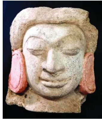
ภาพที่ 10 ประติมากรรมรูปบุคคลชายสวมตุ้มหู แบบก้อนกลมแบน