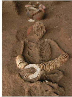
ภาพที่ 3 โครงกระดูกมนุษย์ยุคสำริด คาดว่าน่าจะเป็นผู้นำชุมชน แหล่งโบราณคดีบ้านโนนวัด

ระยะที่ 3 เป็นช่วงเวลาแบบผสมผสาน ยุคภาชนะดินเผา กับกึ่งยุคโลหะ (3,000 – 2,000 ปี) ตุ่มหู โบราณที่ทำขึ้นทำด้วยวัตถุเช่นเดียวกับช่วงเวลาภาชนะดินเผาวัสดุที่ใช้ เช่น หินเขียวหนุมนที่มีสีขุ่นขาว จัสเปอร์แดงทึบ ฟลูออไรด์ และวัสดุธรรมชาติที่ได้รับความนิยมในการผลิตเครื่องประดับในช่วงเวลานี้คือหอยมือเสือยักษ์ และหอยทะเลนานาชนิด