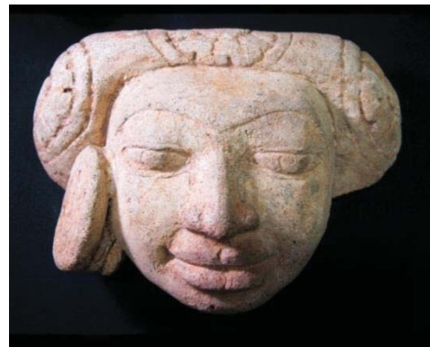
ภาพที่ 11 ประติมากรรมรูปบุคคลหญิงสวมตุ้มหู แบบก้อนกลมแบน