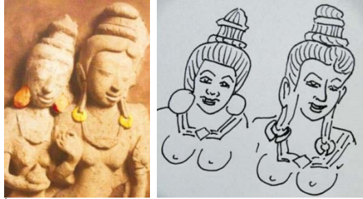
ภาพที่ 6 ตุ้มหูรูปห้วงกลม สมัยทวารวดี โบราณสถานหมายเลข 10 คูบัว

1. รูปห้วงกลม เป็นตุ้มหูที่นิยมใช้ในทุกระดับชนชั้นในสังคมทวารวดี มีทั้งขนาดเล็กและขนาดใหญ่ วัสดุที่ใช้ทำส่วนใหญ่เป็นดินเผา และตะกั่ว