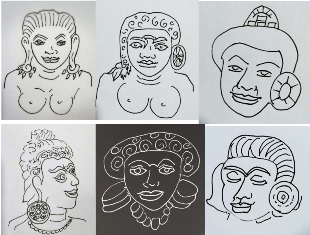
ภาพที่ 12 ภาพวาดลายเส้นจากประติมากรรมปูนปั้น ตุ้มหูทวารวดีแบบต่าง ๆ ไม่มีรูปทรงที่ชัดเจน

7. ไม่มีรูปทรงที่ชัดเจน ในหนึ่งชิ้น มีทั้งแบบที่เป็นรูปทรงกลม และโค้งเป็นลวดลาย