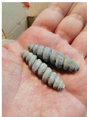
ภาพที่ 9 แบบแถบม้วนตัน ไม่มีรูตรงกลาง รูปทรงกระบอก