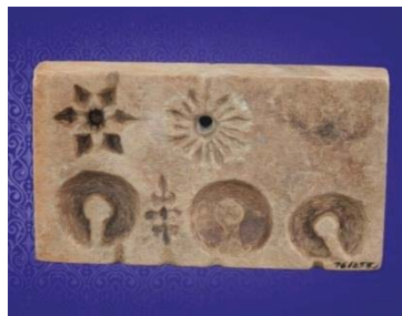
ภาพที่ 4 แม่พิมพ์ตุ้มหู สมัยทวารวดี

ระยะที่ 5 เป็นช่วงเวลาสุดท้าย ภายหลังจากพุทธศตวรรษที่ 10 เป็นช่วงเริ่มต้นวัฒนธรรมทวารวดี เครื่องประดับหินกึ่งรัตนชาติจากเอเชียใต้เสื่อมความนิยมลง แต่แก้วที่ผลิตในภูมิภาคยังคงความนิยมมาจนถึงราวพุทธศตวรรษที่ 20 ในสมัยทวารวดีนี้มีการนำตะกั่วมาใช้เป็นวัสดุทำตุ้มหู มีแม่พิมพ์ในการหล่อตุ้มหู อย่างไรก็ตามเครื่องประดับในยุคหลังมีความแปลกใหม่และมีจำนวนมากขึ้นตามปัจจัยและเงื่อนไขการขยายตัวทางสังคมและวัฒนธรรมที่รับมาจากอินเดีย ต่างหู – ตุ่มหู ก็เปลี่ยนแปลงไป มีหลากหลายขึ้นตามแฟชั่นของแต่ละท้องถิ่น มีหลักฐานให้เห็นจากรูปปูนปั้นในสมัยทวารวดี ที่พบในทั่วเขตภาคกลางของประเทศไทย