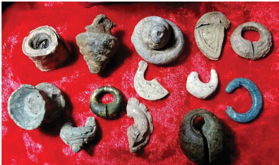
ภาพที่ 13 ตุ้มหูทวารวดีแบบต่าง ๆ ทำจากตะกั่ว สำริดเปือกทอง และแก้วฟ้า