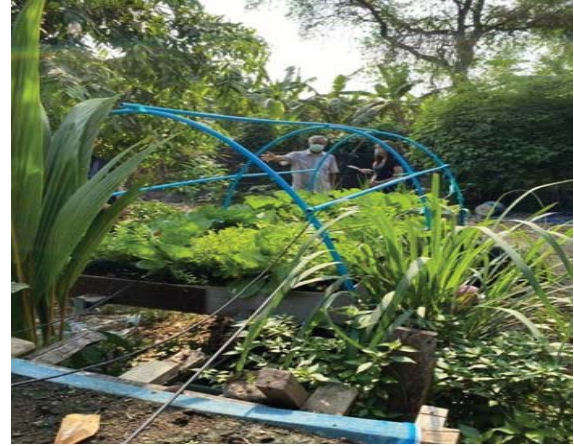
ภาพที่ 4 นายสุธรรม จันทร์อ่อน ปราชญ์ท้องถิ่นในจังหวัดนครปฐม

4.เงื่อนไขคุณธรรม : ลุงสุธรรมมีความอดทน ขยันหมั่นเพียรได้ลงมือลงปลูก เพื่อจะได้ผลผลิตที่ออกมาดีที่สุดปลอดภัยที่สุดให้ส่งถึงผู้บริโภค และผลิตภัณฑ์และผลผลิตของลุงสามารถบอกเรื่องราว และลุงได้อุทิศตนเพื่อสังคม ด้วยการทุ่มเท ถ่ายทอดวิชา และประสบการณ์ความรู้ เกี่ยวกับงานด้านเกษตรแก่ผู้สนใจ โดยลุงสุธรรมได้สอนคนในชุมชนและเด็ก ๆ ด้วยการทำเกษตรด้วยสมอง สองมือ และหัวใจแห่งความพอเพียง คือ ให้ใช้สติปัญญา ความอดทน ความเพียรพยายามใน การทำเกษตร