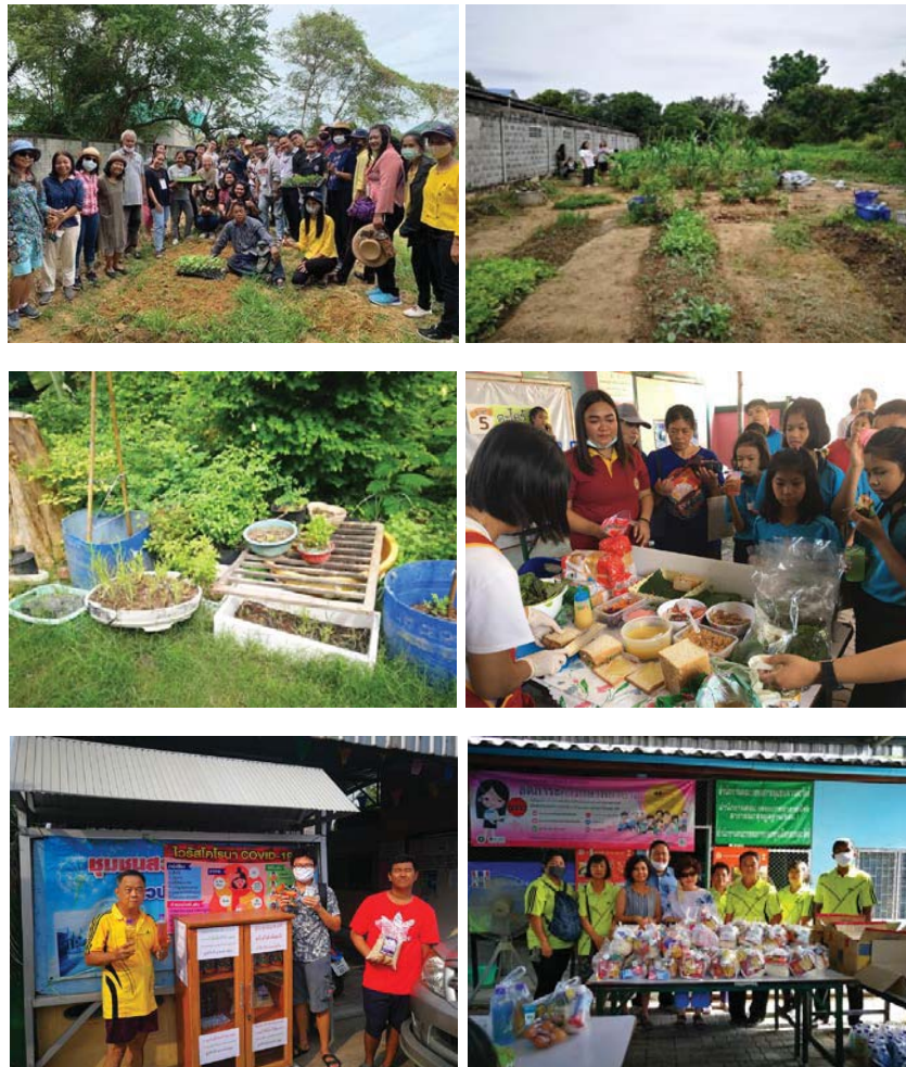
ภาพที่ 2 ภาพบรรยากาศการขับเคลื่อนกระบวนการประสานความร่วมมือเพื่อสุขภาพชุมชนสวนตะไคร้ ภายใต้สถานการณ์การแพร่ระบาดของโรคโควิด-19

3.3.6 เกิดกลุ่มครูภูมิปัญญาพื้นบ้าน มีสมาชิกจำนวน 6 คน ในการร่วมกันถ่ายทอดองค์ความรู้ สู่ประชาชนในชุมชนทุกช่วงวัย ประกอบด้วย 1) องค์ความรู้ด้านการทำเกษตรอินทรีย์ จำนวน 3 คน ได้แก่ การปรุงดินพร้อมปลูก การเพาะต้นกล้า การทำปุ๋ยหมักชีวภาพ การทำจุลินทรีย์สังเคราะห์แสง และการเลี้ยงไก่ไข่ 2) องค์ความรู้ด้านการแปรรูป จำนวน 2 คน ได้แก่ การทำน้ำยาอเนกประสงค์ การทำน้ำดื่มสมุนไพรเพื่อสุขภาพ และการทำขนมแซนวิชหลากไส้เพื่อสุขภาพ เช่น ไส้สลัดผัก ไส้ปู้ด ไส้ทูน่า และไส้โบราณ เป็นต้น และ 3) องค์ความรู้ด้านงานหัตถกรรม จำนวน 1 คน ได้แก่ การตัดเย็บหน้ากากอนามัย และถุงผ้า ทั้งนี้จากการถ่ายทอดองค์ความรู้ไปสู่ประชาชนในชุมชน สามารถนำองค์ความรู้ต่าง ๆ ไปปรับใช้ในชีวิตประจำวันได้อย่างเหมาะสม