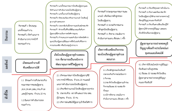
ภาพที่ 1 บันทึบผลลัพธ์โครงการ