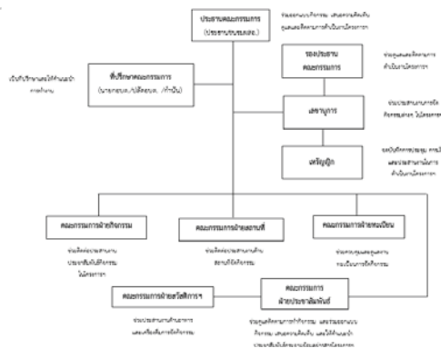
ภาพที่ 2 โครงสร้างของคณะทำงานและบทบาทหน้าที่

องค์ประกอบของคณะทำงานแบ่งออกเป็น 3 ส่วน ได้แก่ ส่วนที่ 1 คณะทำงาน จำนวน 30 คน ประกอบด้วย ที่ปรึกษาคณะกรรมการ ประธานคณะกรรมการ รองประธานคณะกรรมการ เลขานุการ เหรัญญิก คณะกรรมการฝ่ายกิจกรรม คณะกรรมการฝ่ายสถานที่ คณะกรรมการฝ่ายทะเบียน คณะกรรมการฝ่ายสวัสดิการฯ คณะกรรมการฝ่ายประชาสัมพันธ์ ส่วนที่ 2 คณะกรรมการโรงเรียนผู้สูงอายุ จำนวน 20 คน และส่วนที่ 3 คณะทำงานแกนนำ 3 ช่วงวัย (วัยเด็ก วัยทำงาน วัยผู้สูงอายุ) จำนวน 30 คน โดยการสรรหาคณะทำงานซึ่งพิจารณาจากบุคคลที่มีส่วนสำคัญในการขับเคลื่อนโครงการ มีความสามารถในการประสานงาน เป็นบุคคลหรือหน่วยงานที่จะสามารถเสริมพลังหรือเชื่อมโยงกับคนในพื้นที่ โดยกำหนดโครงสร้างเครือข่ายการดำเนินงานและบทบาทหน้าที่แต่ละฝ่าย ดังภาพที่ 2