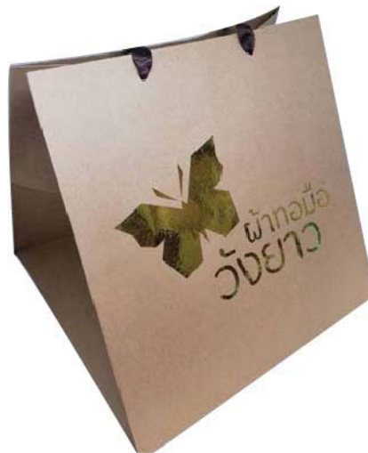
ภาพที่ 5 ตราสัญลักษณ์และบรรจุภัณฑ์กลุ่มผ้าทอมือบ้านวังยาวจังหวัดสระแก้วที่ได้ปรับปรุงแก้ไขจามข้อเสนอแนะของผู้เชี่ยวชาญ