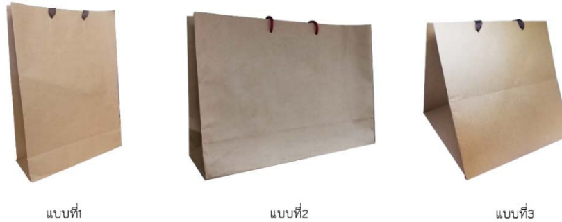
ภาพที่ 4 รูปแบบบรรจุภัณฑ์ผ้าทอมือบ้านวังยาวจำนวน 3 รูปแบบ

ข้อเสนอแนะเพื่อปรับปรุงแก้ไขบรรจุภัณฑ์โดยผู้เชี่ยวชาญด้านการออกแบบตราสัญลักษณ์และบรรจุภัณฑ์ได้เสนอแนะเลือกความหนาของเนื้อกระดาษให้มีความเหมาะสมเพื่อช่วยลดต้นทุนในการผลิต และความลดความยาวของหูหิ้วเพื่อให้สะดวกต่อการใช้งาน