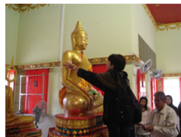
รูปภาพที่ 2 นำเที่ยววัดบางระกำ (สุขวัฒนาราม)