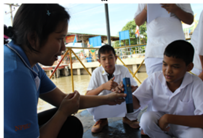
รูปภาพที่ 3 ตรวจวิเคราะห์คุณภาพน้ำโดยนักเรียนโรงเรียนวัดสุขวัฒนาราม