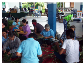
รูปภาพที่ 1 อยู่ดี มีสุข ของชาวบางระกำ