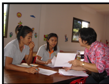
รูปภาพที่ 4 ศูนย์พัฒนาเด็กเล็กชุมชนบางระกำ