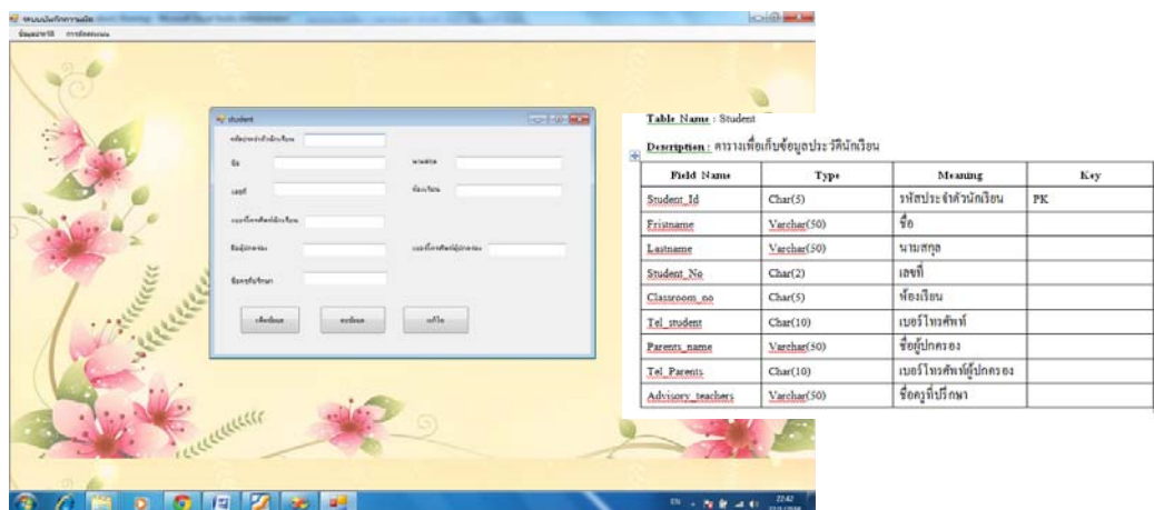
รูปภาพที่ 1 ความสัมพันธ์เมนูการจัดการข้อมูลผู้ในระบบกับตารางนักเรียน

การออกแบบส่วนติดต่อกับผู้ใช้งาน : หน้าจอของระบบ หรือส่วนติดต่อผู้ใช้งาน ได้มีการออกแบบให้เชื่อมและสัมพันธ์กันกับระบบฐานข้อมูล โดยที่แต่ละหน้าจะมีส่วนที่เชื่อมโยงกับฐานข้อมูลตารางต่าง ๆ ดังนี้