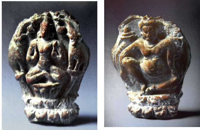
ภาพที่ 4 ดินเผาสมัยทวารวดี ด้านหนึ่งคือ อภิเชกพระศรี หรือคชลักษณ์ และอีกด้าน คือ กุเวร