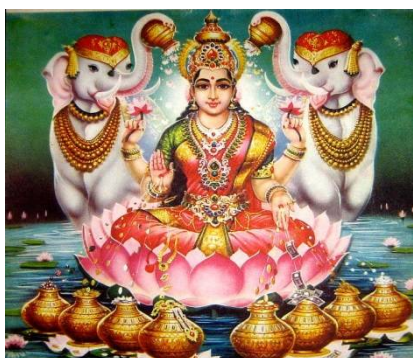
ภาพที่ 3 พระศรี หรือคชลักษณ์