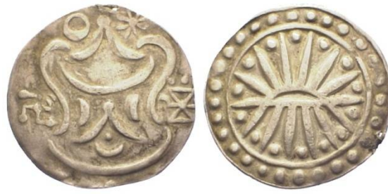
ภาพที่ 2 สัญลักษณ์มงคลของอินเดียที่ปรากฏบนเหรียญเงินสมัยพุนัน