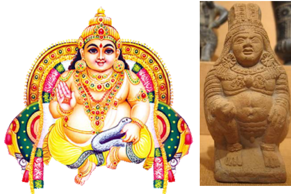
ภาพที่ 5 กุเวร (Kubera) ของชาวอินเดีย