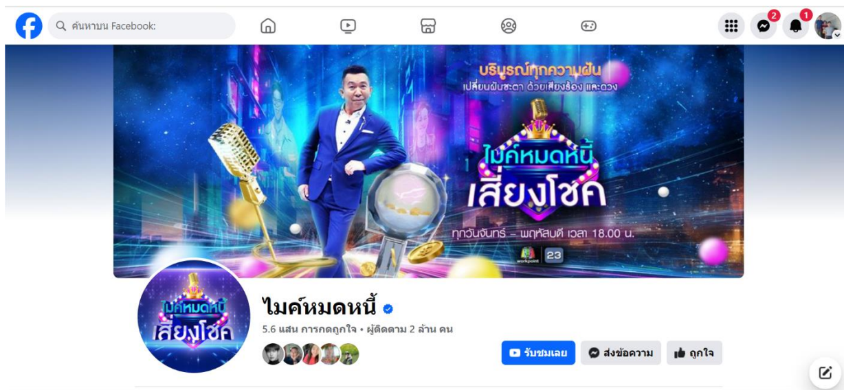
ภาพที่ 2 รายการโทรทัศน์ถ่ายทอดผ่านแอปพลิเคชันเฟสบุ๊ก

[4]