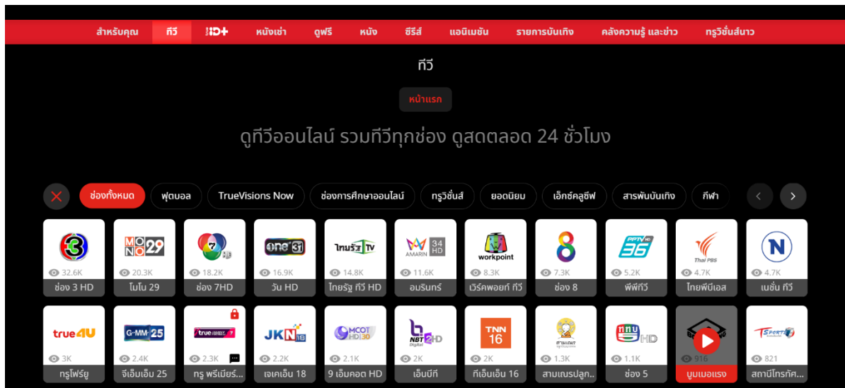
ภาพที่ 3 ช่องทีวีออนไลน์