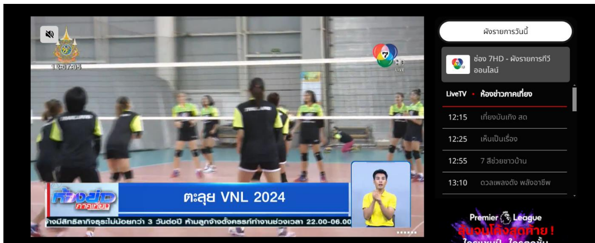
ภาพที่ 4 ทีวีออนไลน์