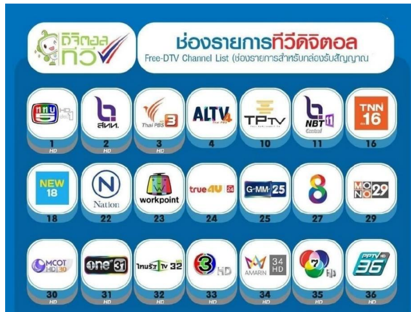
ภาพที่ 1 ช่องรายการทีวีดิจิทัล