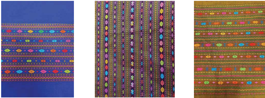
ภาพที่ 4 ผลิตภัณฑ์ผ้าทอตีนจกเชิงสร้างสรรค์ จากการเพิ่มจำนวนลวดลายบนผืนผ้า ที่มา: แพรภัทธ [3]

แนวทางที่ 1 การเพิ่มจำนวนลวดลายบนผืนผ้า ช่างทอผ้าได้เพิ่มลายจกจำนวนมากขึ้น เพื่อให้ผ้าทอตีนจก มีความสวยงาม มีลวดลายหลากหลาย มีคุณค่าและมูลค่าเพิ่มขึ้น ตอบสนองความต้องการของผู้บริโภคที่นิยมใช้ผ้า ทอตีนจกที่มีลวดลายมาก