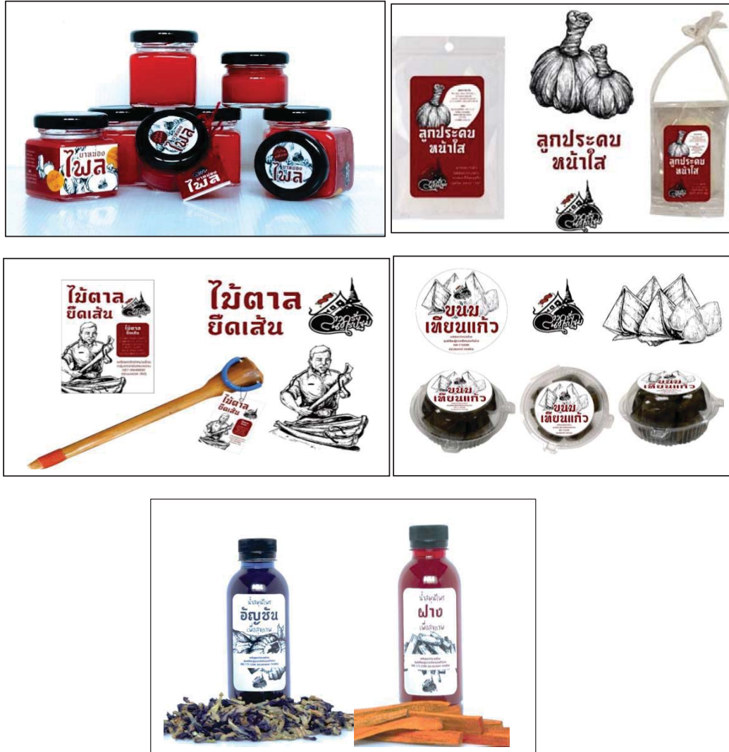
ภาพที่ 1 ผลิตภัณฑ์สร้างสรรค์จากผลิตภัณฑ์เสริมสร้างสุขภาพ

ลูกประคบหน้าใส 3) ไม้ตาลภูมิปัญญาลาวครั้ง 4) ขนมหเทียนลาวครั้ง 5) น้ำสมุนไพรสร้างสุขภาพ จากอัญชันและฝาง ผลิตภัณฑ์เสริมสร้างสุขภาพ มีลักษณะของผลิตภัณฑ์ ดังภาพที่ 1