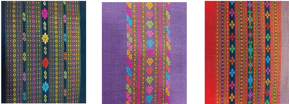
ภาพที่ 6 ผลิตภัณฑ์ผ้าทอตีนจกเชิงสร้างสรรค์ จากการพัฒนาลวดลายใหม่บนผืนผ้า ที่มา: แพรภัทร [3]

แนวทางที่ 3 การพัฒนาลวดลายใหม่บนผืนผ้า ช่างทอสร้างมูลค่าเพิ่มให้กับผ้าทอโดยได้เพิ่มลวดลายใหม่ ได้แก่ ลายทวารวดี ลายขอเจ้าฟ้าฯ ลายดอกเฟื่องฟ้า ลายดอกบานชื่น ลายหัวใจร้อยรัด มาทอเป็นลายประกอบมากขึ้น ช่วยสร้างสรรค์ลวดลายในผืนผ้า ทำให้ผ้าทอมีลวดลายใหม่ๆในผืนผ้าเพิ่มขึ้น