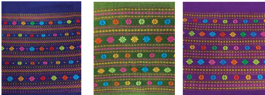
ภาพที่ 3 ผลิตภัณฑ์ผ้าทอตีนจกลายดอกมะเตือของกลุ่มทอผ้าตีนจกโพรงมะเตือ