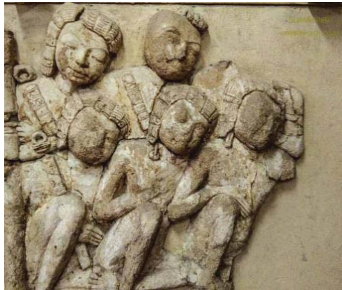
ภาพที่ 3 ปูนปั้นรูปนักรบทวารวดี พบที่เจดีย์จุลประโทน จัดแสดงในพิพิธภัณฑสถานแห่งชาติพระปฐมเจดีย์