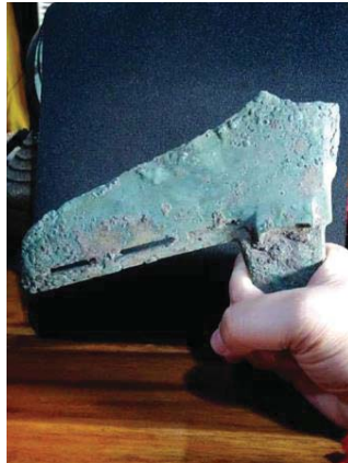
ภาพที่ 6 “เกอ”อาวุธทหารราบคล้ายของจีนที่ค้นพบตรงกับสมัยทวารวดี