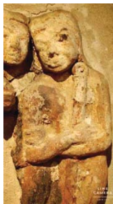
ภาพที่ 7 ประติมากรรมปูนปั้นนักรบสมัยทวารวดี แสดงให้เห็นดาบที่คล้ายดาบท้ายห้วงของจีน ที่มา : ภาพจากโบราณสถานสมัยทวารวดี

อย่างไรก็ตาม แม้ว่าดาบโบราณทวารวดีที่พบจะมีลักษณะเหมือนกับดาบเหิงเตาหรือดาบหวนโส่วตาวเป็นอย่างมาก แต่ดาบดังกล่าวกลับมีลักษณะพิเศษอย่างหนึ่งที่ดาบเหิงเตาและดาบร่วมสายสกุลไม่มี คือกระบ้งมือของดาบที่มีขนาดใหญ่ เพราะดาบหวนโส่วเตาและเหิงเตาส่วนมากจะไม่มีกระบ้งมือ หรือถ้ามีก็เป็นเพียงกระบ้งมือขนาดเล็กเท่านั้น จึงทำให้เชื่อได้ว่าดาบโบราณที่พบน่าจะเป็นดาบที่ชนพื้นเมืองในสมัยทวารวดี ที่มีการประยุกต์รูปแบบของตนขึ้นมาเอง อย่างไรก็ตาม มีการค้นพบดาบชนิดนี้ในหลายพื้นที่ ทั้งในแม่น้ำ และบนบก ที่มีอายุร่วมสมัยทวารวดี ดาบดังกล่าวจะพบในแถบบริเวณจังหวัดลพบุรี ชัยภูมิ กาญจนบุรี ฯลฯ และสิ่งหนึ่งที่พบจากดาบทวารวดีคือเอกลักษณ์ของดาบนี้คือหน้าดาบที่คล้ายกับดาบจีนในสมัยราชวงศ์ถัง ช่วงท้ายดาบจะมีสัญลักษณ์รูปดอกโบตั๋น ซึ่งเป็นสัญลักษณ์มงคลอย่างหนึ่งของจีน และบางเล่มปรากฏสัญลักษณ์มงคลตามความเชื่อพื้นเมือง เช่น รูปหงส์ นอกจากนี้ยังมีการค้นพบศาสตราวุธอีกชนิดหนึ่งบนแผ่นดินไทยที่อยู่ร่วมสมัยทวารวดี มีลักษณะคล้ายอาวุธของจีน