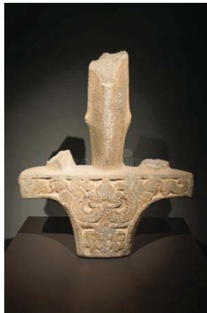
ภาพที่ 8 ดาบทวารวดี จะเห็นว่ามียกกระบังที่ใหญ่ พบที่เมืองโบราณศรีมโหสถ ปราจีนบุรี

ที่เรียกว่า เกอ หรือขวางเกอจี อาวุธของจีนที่ใช้สำหรับทหารราบในเหล่ากองทหารคุ้มกันรถศึก อาวุธชนิดนี้ไว้ใช้ฟันเข้าศึก หรือเพื่อเกี่ยวดึงคนจากหลังม้า ใช้ได้ทั้งฟันแทง และรับดาบของศัตรู ลวดลายบนอาวุธเป็นลายวนขดเป็นวงกลมซ้อนกันหลายชั้น จึงเป็นลายแบบราชวงศ์อื่น หมายถึง พระอาทิตย์ หรือลม อาวุธแบบนี้พบไม่มากในไทย ที่มีการพบอาวุธชนิดนี้มาตั้งแต่ 2,500 ปีก่อน จนกระทั่งมาถึงสมัยทวารวดี นักวิชาการสันนิษฐานว่า มีการรับอิทธิพลในการสร้าง โดยเข้ามาสองเส้นทาง คือ ทางแรก เข้ามาพร้อมกับการติดต่อกับกลุ่มวัฒนธรรมดองซอน อายุประมาณ 2,000 – 2,500 ปีมาแล้ว โดยอาศัยแม่น้ำน่านเชื่อมต่อไปยังแม่น้ำโขง ซึ่งในเวลานั้นราชวงศ์ฮั่นตะวันออก ได้แผ่อิทธิพลมาถึงกวางซี และทางตอนเหนือของเวียดนาม เกอ อาจเข้ามาพร้อมกับการแลกเปลี่ยนทางการค้าในยุคต้น ประการที่สอง เกอ อาจเป็นของขวัญที่ใช้เชื่อมความสัมพันธ์ทางการเมือง จากราชวงศ์ฮั่นตะวันออก [9]