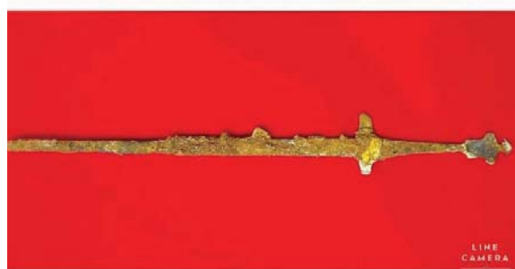
ภาพที่ 4 ลักษณะของดาบท้ายหรง คล้ายดาบของจีนที่ค้นพบตรงกับสมัยทวารวดี

จากการศึกษาหลักฐานทางประวัติศาสตร์และโบราณคดี ที่สามารถนำมาเป็นหลักฐานถึงการมีของศาสตราวุธพบว่า ในสมัยทวารวดี มีการปกครองโดยกษัตริย์ ดังนั้นจึงต้องมีนักรบเพื่อปกป้องบ้านเมืองให้สงบสุข ทวารวดีเป็นเมืองพุทธที่มีการนับถือพระพุทธศาสนาทั้งนิกายหินยาน และมหายาน มีการนับถือเทพเจ้าทางศาสนาพราหมณ์ โบราณวัตถุที่ค้นพบ จึงสร้างขึ้นเนื่องด้วยความศรัทธาในพระพุทธศาสนา ได้แก่ พระสถูป เจดีย์ และมีลวดลายมงคลที่รับความเชื่อมาจากศาสนาพราหมณ์ ปรากฏบนวัตถุที่ใช้ในพิธีกรรมเพื่อความศักดิ์สิทธิ์ จากการศึกษาค้นคว้างานประติมากรรมปูนปั้นในสมัยทวารวดี ที่เป็นรูปบุคคลปูนปั้นประดับศาสนสถาน ที่ได้กล่าวถึงเรื่องราววิถีชีวิตและใบหน้าของบุคคลในสมัยนั้น พบว่า มีชิ้นงานที่ช่างฝีมือสร้างสรรค์เป็นรูปนักรบทวารวดี ได้แก่ ปูนปั้นรูปนักรบพบที่เจดีย์จุลประโทน เป็นรูปนักรบ 5 คน ในท่วงทำนองซันเขา แต่สิ่งที่สังเกตได้ว่าคนกลุ่มนี้เป็นนักรบ คือทุกคนมีดาบประจำตัวสะพายอยู่ด้านหลัง นอกจากนี้ยังปรากฏหลักฐานที่แสดงถึงนักรบ และศาสตราวุธในสมัยทวารวดี อีกประเภทหนึ่ง ได้แก่ ภาพที่ปรากฏบนเศษภาชนะดินเผา ที่พบที่เมืองจันทเสน จังหวัดนครสวรรค์ แสดงรูปนักรบในมือถืออาวุธคล้ายมีดสั้น เหมือนกำลังต่อสู้