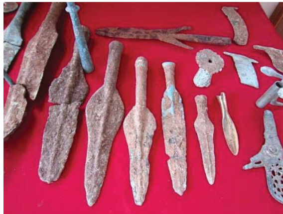
ภาพที่ 2 ศาสตราวุธสมัยทวารวดี ในอาคารแสดงโบราณวัตถุสมัยทวารวดี โรงเรียนบ้านไร่ประชาสรรค์ จังหวัดนครสวรรค์

ต่อมาในยุคสมัยประวัติศาสตร์ ตั้งแต่สมัยสุโขทัยเป็นต้นมา จึงมีการรับอิทธิพลและปรับปรุงให้มีความงดงามและใช้ประโยชน์ในการศึกษาธรรมให้ดียิ่งขึ้น จวบจนกระทั่งปัจจุบัน