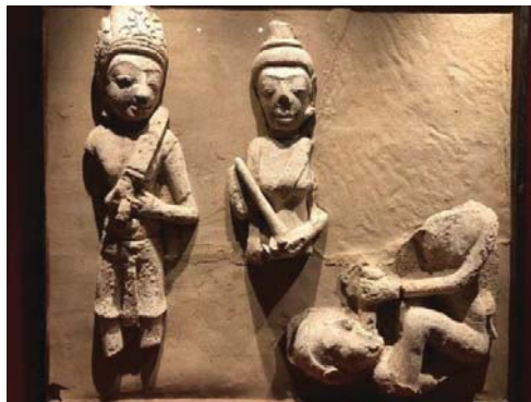
ภาพที่ 9 ประติมากรรมปูนปั้นพบที่คูบัว ราชบุรี เป็นการลงโทษโดยมีผู้คุมเฝ้าดูนักโทษนั้นถูกผู้ลงโทษยัดบางอย่างเข้าไปในปาก