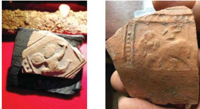
ภาพที่ 5 ภาพบนเศษภาชนะดินเผา พบที่เมืองจันเสน จังหวัดนครสวรรค์ แสดงรูปนักรบถืออาวุธเหมือนกำลังต่อสู้