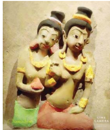
ภาพที่ 2 ประติมากรรมปูนปั้นเจ้าหญิงและนางใน เจดีย์หมายเลข 10 เมืองโบราณคูบัว ราชบุรี