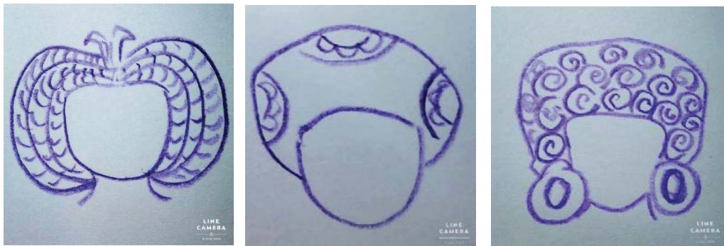
ภาพที่ 4 รูปแบบทรงผมของสตรีสมัยทวารวดี มีลักษณะเป็นลอนต่อกันรอบศีรษะ

จากลักษณะของทรงผมสตรีสมัยทวารวดีในลวดลายปูนปั้นที่กล่าวมานี้ จะเห็นได้ว่ามีรูปแบบของความงามที่เป็นลักษณะเฉพาะ ดูเรียบง่าย แต่คงไว้ที่ดูเรียบร้อย ไม่รกรุงรัง สะอาดตา แต่จะเน้นให้ความสวยงามด้วยการตกแต่งด้วยเครื่องประดับที่เป็นค่านิยมแห่งความงามสมัยทวารวดี ที่สะท้อนออกมาในงานปูนปั้น ที่สามารถบ่งบอกได้ถึงชนชั้นทางสังคม เช่น การสวมเครื่องประดับตกแต่งเรือนผมที่มีค่า เช่น เครื่องประดับที่ทำจากทองคำ และวัสดุที่มีค่า ความนิยมอีกอย่างของสาวชาวทวารวดีคือการนิยมไว้ผมยาว มากกว่าผมสั้น จะนิยมเกล้าเป็นมวย มากกว่าปล่อยยาว ซึ่งคล้ายกับค่านิยมสมัยต่อ ๆ มา เช่น สุโขทัย และอยุธยา ที่นิยมไว้ผมยาว อาจแสดงให้เห็นว่าในสมัยทวารวดีอาจไม่ค่อยมีสงครามเหมือนสมัยอยุธยา