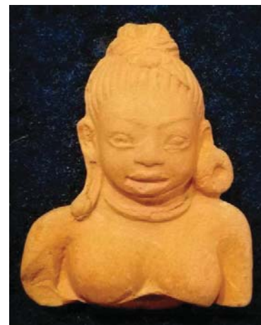
ภาพที่ 8 ประติมากรรมดินเผาขนาดเล็กสตรีพื้นเมือง จันเสนา จังหวัดนครสวรรค์ แสดงร่างกายที่หล่อหนา หน้าอกใหญ่