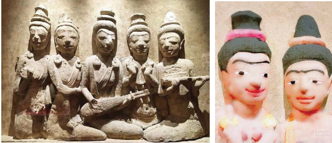
ภาพที่ 3 ทรงผมเกล้ามวยสูงของนักดนตรีหญิง 5 คน เจดีย์หมายเลข 10 เมืองโบราณคูบัว ราชบุรี ที่มา: http://www.oknation.net/ ภาพจากงานวิจัยลงสีใบหน้าคนทวารวดี โดยสุพิชฌาย์ จินดาวัฒนภูมิ

ปั้นแสดงเรื่องราวชาดก พระยาฉัตรทนต์ และพรานโสนุตร แต่บริเวณที่พบรูปปูนปั้นบุคคลสตรี ได้แก่ เจดีย์ หมายเลข 1 และ 3 มีลักษณะการแต่งกายในงานประติมากรรม แสดงให้เห็นว่าเป็นการแต่งกายแบบอินเดีย [8]