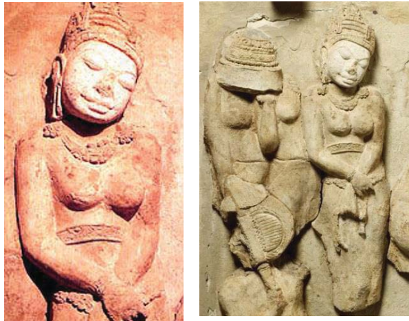
ภาพที่ 1 ประติมากรรมปูนปั้นเจ้าหญิงหรือชนชั้นสูง ลวดลายปูนปั้น เจดีย์จุลประโทน นครปฐม