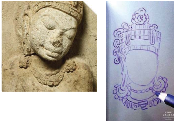
ภาพที่ 6 ประติมากรรมปูนปั้นแสดงให้เห็นถึงใบหน้าของสตรีทวารวดี กลม แป้น คิ้วโค้ง จมูกใหญ่ ปากใหญ่หนา

จากที่กล่าวมานี้ งานประติมากรรมปูนปั้นและดินเผา แสดงให้เห็นว่าความงามของใบหน้าสตรีสมัยทวารวดี ที่กล่าวมาทั้ง 4 ลักษณะ นี้ ลักษณะที่ดูเป็นที่ยอมรับถึงความงาม คือ ลักษณะที่มีใบหน้ารูปไข่ หน้าผากกว้าง ในขณะที่ช่วงคางจะเรียวยาวได้รูป ในส่วนของคิ้ว แต่เดิมคิ้วอาจเข้มหนา แต่นิยมโกนคิ้วให้เรียวโค้งบาง สอดรับกับรูปร่างที่บอบบาง เอวคอด มีเนินพุงน้อยๆ สตรีกลุ่มนี้จะเป็นสตรีที่อยู่ในวัง หรือเป็นบุคคลชั้นสูง ความงามของสตรีชั้นสูงดูจะเป็นที่นิยมว่างามสมสมัย ที่นิยมมาทุกยุคสมัย แต่อย่างไรก็ดี รูปประติมากรรมดินเผาขนาดเล็ก ที่พบเป็นจำนวนมากที่เมืองจันเสน จังหวัดนครสวรรค์ ที่สร้างเป็นชิ้นงานทั้งตัว จะแสดงให้เห็นความงามของสัดส่วนของสตรี ที่มีกล้ามเนื้อที่แข็งแรง