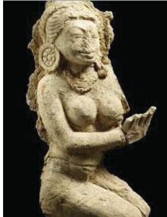
ภาพที่ 7 ประติมากรรมปูนปั้นสตรี นิยมสวมตุ้มหูตกแต่งเพื่อความงาม เจดีย์จุลประโทน จังหวัดนครปฐม