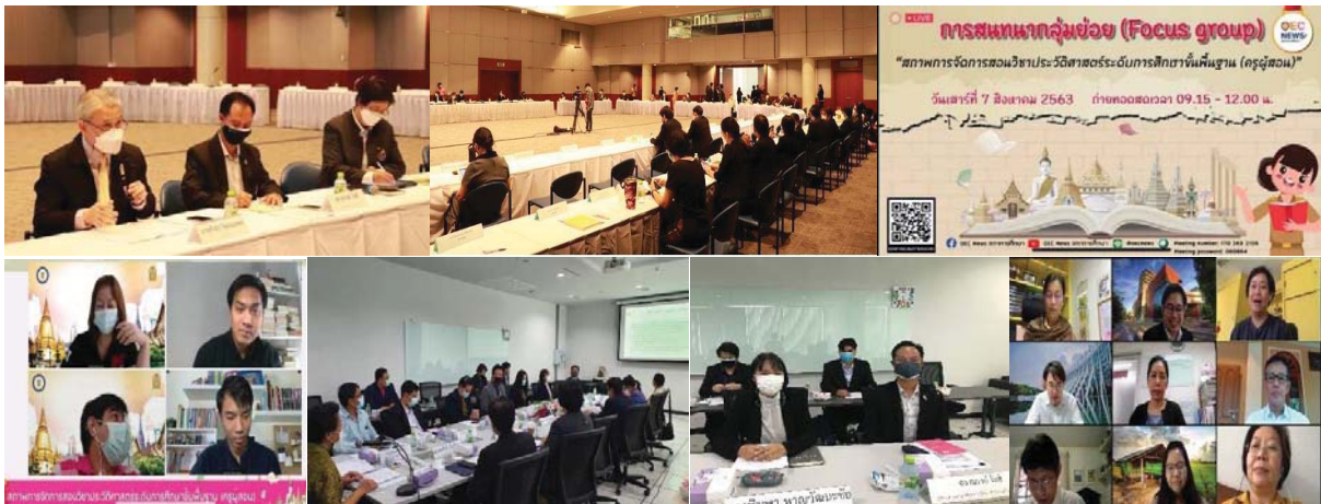
ภาพที่ 2 กิจกรรมที่ดำเนินการจัดทำรูปแบบ “GAME MODEL” ของการฝึกอบรมครูผู้สอนวิชาประวัติศาสตร์ฯ จังหวัดปทุมธานี

6.2 ผลการพัฒนาารูปแบบการฝึกอบรมครูผู้สอนวิชาประวัติศาสตร์ในโรงเรียนมัธยมศึกษาตอนปลายของจังหวัดปทุมธานี สำหรับครูผู้สอนวิชาประวัติศาสตร์เพื่อให้ความรู้ความเข้าใจในเรื่องการจัดการเรียนรู้เชิงรุก (Active Learning) โดยใช้รูปแบบ “GAME MODEL” โดยผู้เชี่ยวชาญได้ประเมินผลของรูปแบบว่ามีความเหมาะสมและเป็นไปได้ ซึ่งมีค่าเฉลี่ยร้อยละ 60 ขึ้นไป