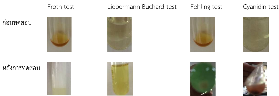
ภาพที่ 1 สีของสารละลายทดสอบปฏิกิริยาการเกิดสีของสารสกัดเมทานอลจากเควอรัลีนเปรี๊ยะ