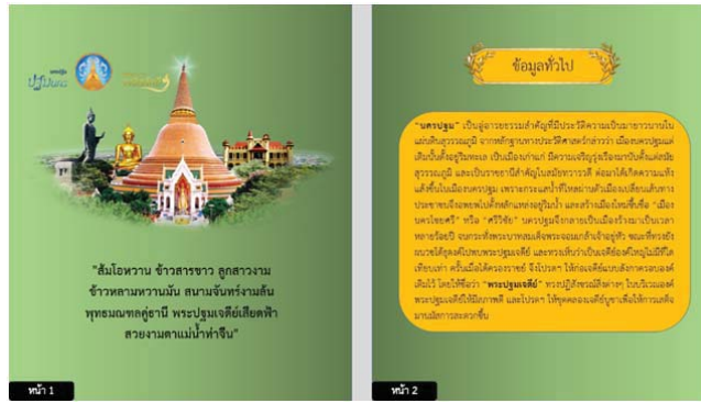
ภาพที่ 2 ข้อมูลทั่วไป เป็นอุ่อารยธรรมสำคัญที่มีประวัติความเป็นมายาวนานในแผ่นดินสุวรรณภูมิ จากหลักฐานทางประวัติศาสตร์กล่าวว่าเมืองนครปฐม