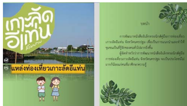
ภาพที่ 1 หน้าปกหนังสืออิเล็กทรอนิกส์ (E-Book) และบทนำ