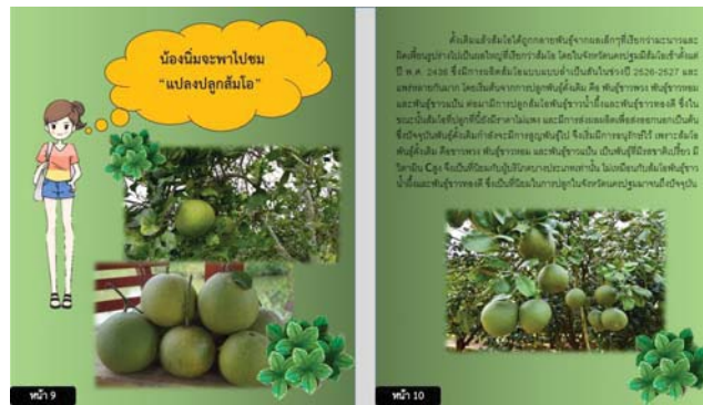
ภาพที่ 2 การแปลงปลูกส้มโอ ตั้งแต่แล้วต้มโอได้ถูกกลายพันธุ์จากผลเล็ก ๆ ที่เรียกว่ามะนาวและผิตเพี้ยนรูปร่างไปเป็นผลใหญ่ที่เรียกว่าส้มโอโดยในจังหวัดนครปฐมมีส้มโอเข้าตั้งแต่ปี พ.ศ. 2436