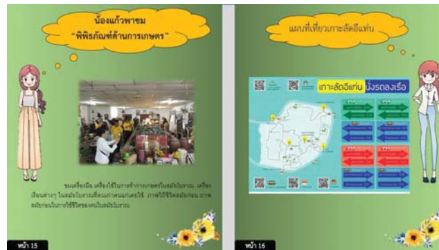
ภาพที่ 3 พิพิธภัณฑ์การเกษตร และแผนที่เกาะลัดดีแลนด์ชมเครื่องมือเครื่องใช้ในการทำการเกษตรในสมัยโบราณเครื่องเรือนต่าง ๆ ในสมัยโบราณที่คนเฒ่าคนแก่เคยใช้ภาพวิถี