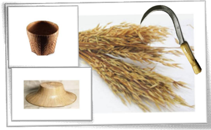
ภาพที่ 4 ตัวอย่างอุปกรณ์ในการแสดง