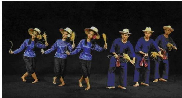
ภาพที่ 1 ตัวอย่างการสร้างสรรค์ทำรำจากท่าทางการเกี่ยวข้าว