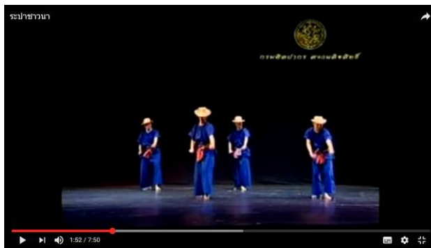
ภาพที่ 2 ตัวอย่างการสร้างสรรค์ทำรำมาจากท่าทางการไถนา