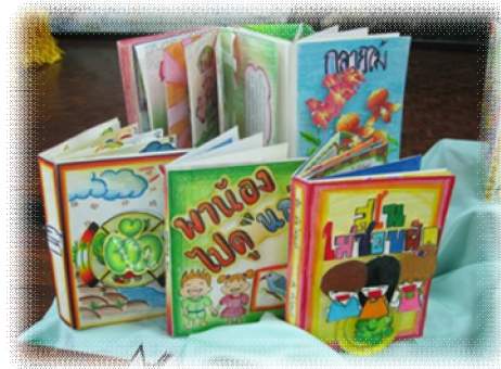
ภาพที่ 5 ตัวอย่างหนังสือเล่มเล็ก

ครูกำหนดให้นักเรียนแต่ละกลุ่ม สร้างสรรค์ทำรำ โดยคิดประดิษฐ์ท่ารำจากการวิเคราะห์ท่าทางการประกอบอาชีพ ในท้องถิ่น มาสร้างสรรค์ท่ารำให้เกิดความอ่อนช้อย แล้วเขียนสรุปข้อมูลท่ารำและองค์ประกอบต่างๆในการสร้างสรรค์ท่ารำ ประกอบเพลงลงในรูปแบบของหนังสือเล่มเล็ก จากนั้นนักเรียนฝึกปฏิบัติท่ารำร่วมกันในกลุ่ม