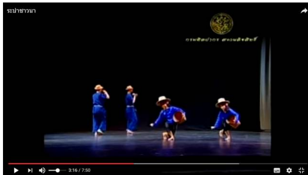
ภาพที่ 3 ตัวอย่างการสร้างสรรค์ทำรำมาจากท่าทางการหว่านเมล็ดข้าว