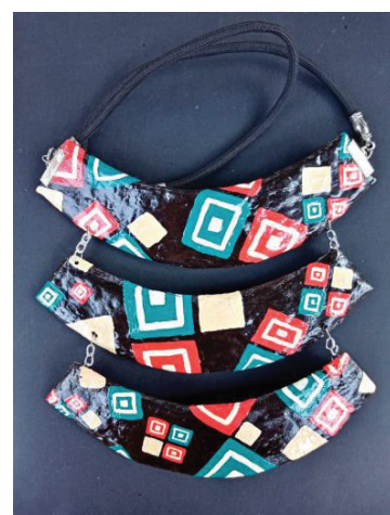
ภาพที่ 1 สร้างสรรค์จากลายขอกูด ลายตานกแก้ว ลายดอกเต้า ลายหน้าเสื่อ ลายข้าวหลามตัด และลายสายรุ้ง